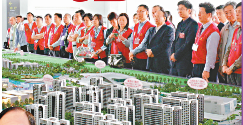
聽關於亞運城建設的介紹(本報攝)

按照三人的設想，可以在廣州亞運中選取一些受觀眾歡迎的決賽項目，如110米欄、體操、跳水等，在特定的影院和場館內進行直播，既不影響目前廣州亞運已有的相關轉播協議，又為本次亞運會帶來更多的亮點與關注。