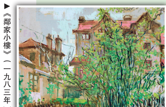
《鄰家小樓》（一九八三年）