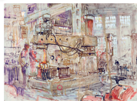
《紡織機械廠》（一九八八年）

觀任微音的畫作，儘管尺幅都不大，然而無論是自然風光還是市井街巷、工廠農田，抑或花卉靜物，皆以嫺熟自由的書