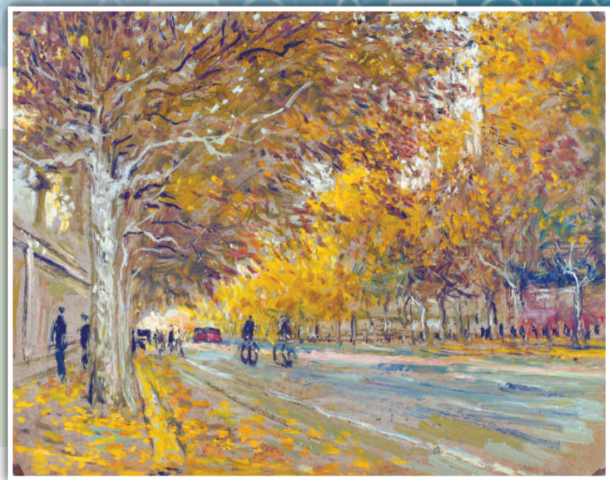
《衡山路》（一九八四年）