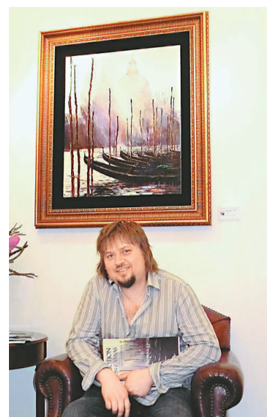
為亮麗鮮艷。Gleb 這幅《Morning light in Venice》是他一大早起來看威尼斯的日出而創作

Gleb 除了經常到各地遊歷、寫生，他曾任過烏克蘭，間中也任倫敦，但他現在還是居住在聖彼得堡的家。他坦言，在九八年經濟環境欠佳的時候，