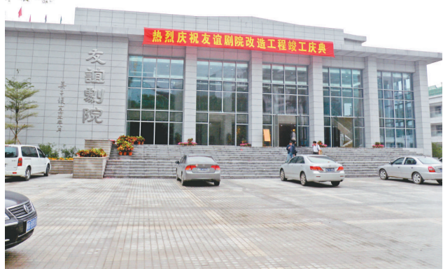
友誼劇院改造工程竣工，重新開放

【本報訊】記者黃寶儀廣州報導：廣東省文化建設重點項目——友誼劇院改造工程全面竣工，在繼承和發揚原有嶺南特色的園林式建築風格上，又創新地增加了許多文化和現代科技元素，劇院功能得到全面完善和提升。劇院竣工後免費試演五場節目進行設備調試，試演劇目包括《騎樓晚風》和話劇《與妻書》。