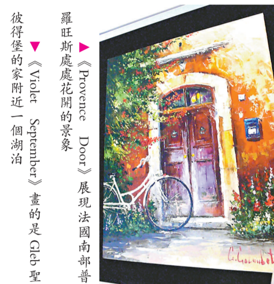
彼得堡的家附近一個湖泊