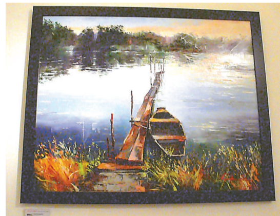
羅旺斯處處花開的景象