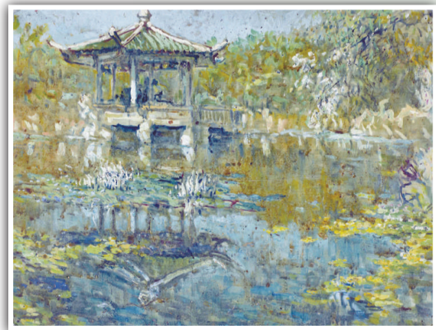
《漕溪公園》（一九七八年）