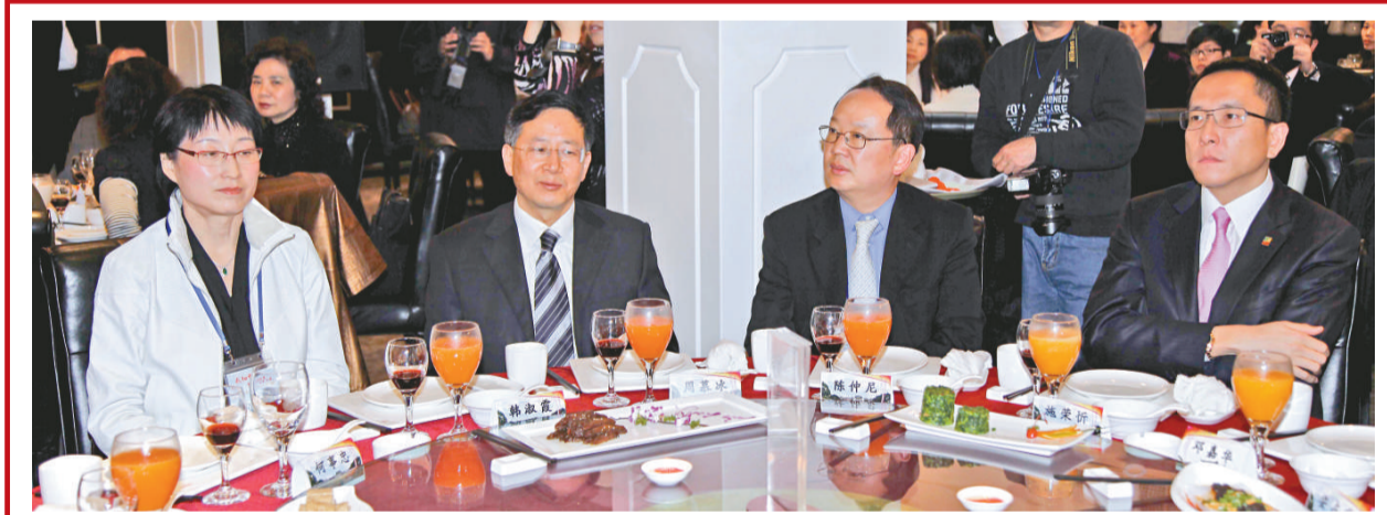
▲（左起）中聯辦青年工作部部長韓淑霞、重慶市副市長周慕冰、副團長陳仲尼、副團長施榮忻在歡迎宴會上（本報記者鄭雷攝）