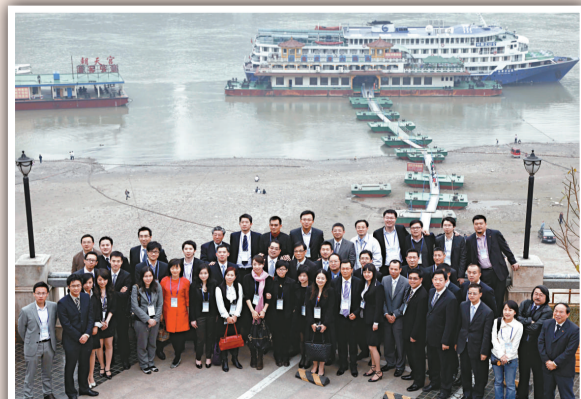
▲香港青年才俊重慶參訪團部分成員在長江和嘉陵江交匯處的重慶市規劃館外合影留念（本報記者鄭雷攝）