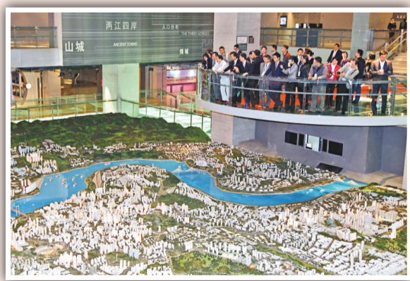
▲香港青年才俊重慶參訪團在重慶市規劃展覽館