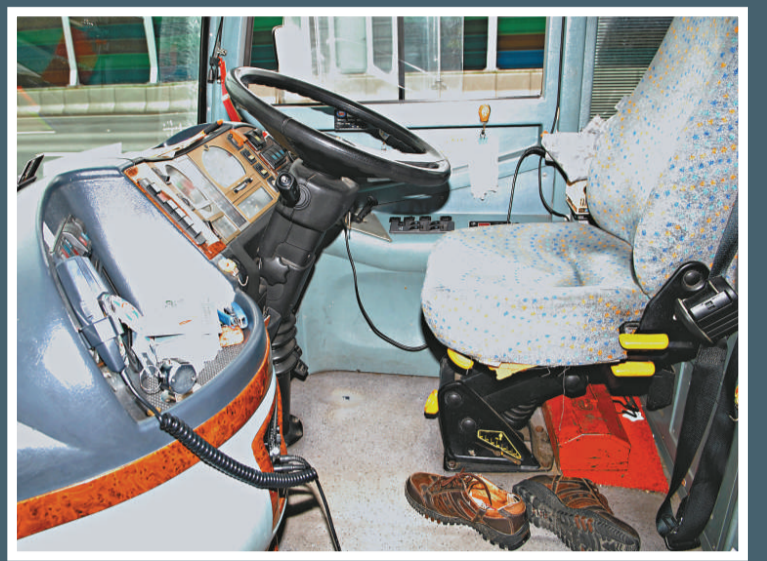
▲死者的司機座位下還留下他穿過的鞋子 ▲猝死司機出事時所駕駛的直通巴士