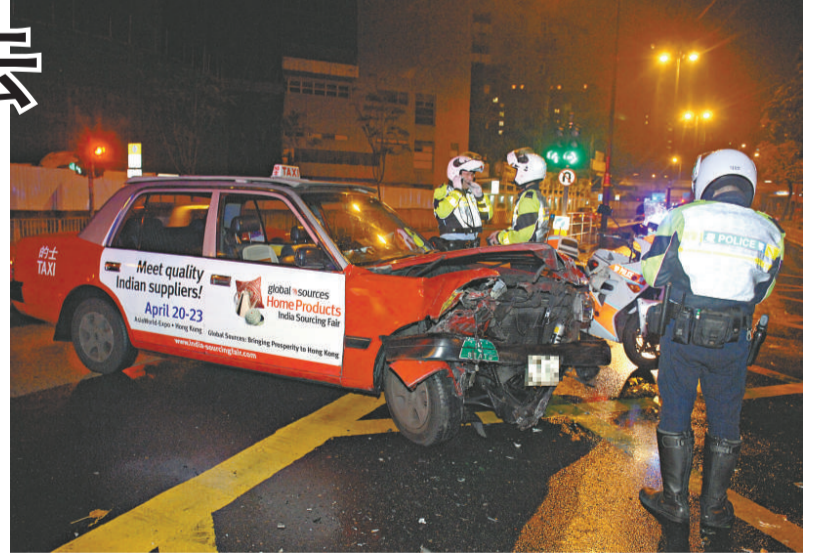
▶與平治相撞的的士車頭受損

，迎面一輛「平治」私家車駛至，該車疑收掣閃避不及，與的士迎頭相撞，兩車車頭均輕微撞毀，而肇事「平治」私家車沒有停車，即時逃離現場，損毀零件散滿地上，的士司機受傷報警。救護員接報到場，將受傷司機包紮送院，幸傷勢輕微。警員根據的士司機提供資料通知各巡邏單位兜截肇事「平治」私家車歸案，其後警方在佐敦道發現一輛車頭損毀的「平治」私家車，經調查後證實與案無關。