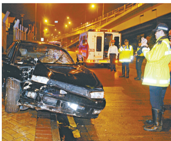
▲私家車剷上行人路車頭盡毀 ▲涉嫌「頂包」的男子被警方拘捕

【本報訊】油麻地一輛私家車昨日凌晨失事剷上行人路，車頭嚴重損毀，司機逃離現場，警員到場調查期間，兩名男子突然出現，其中一名男子更自稱肇事司機，警員懷疑有人涉嫌「頂包」，將兩人一併拘捕，案件列作妨礙司法公正及交通意外處理。