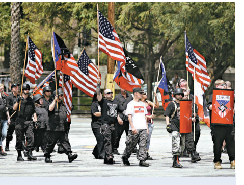
新納粹分子在洛杉磯遊行

目擊者稱，一名男子脫去了上衣，展示他身上的納粹燈泡紋身圖案，引起敵對示威者不滿，雙方初則口角，繼而動武。有人見到多名便衣探員上前合力拉走該名紋身男子，但他奮力掙扎，不停地揮拳及起飛腳踢人。