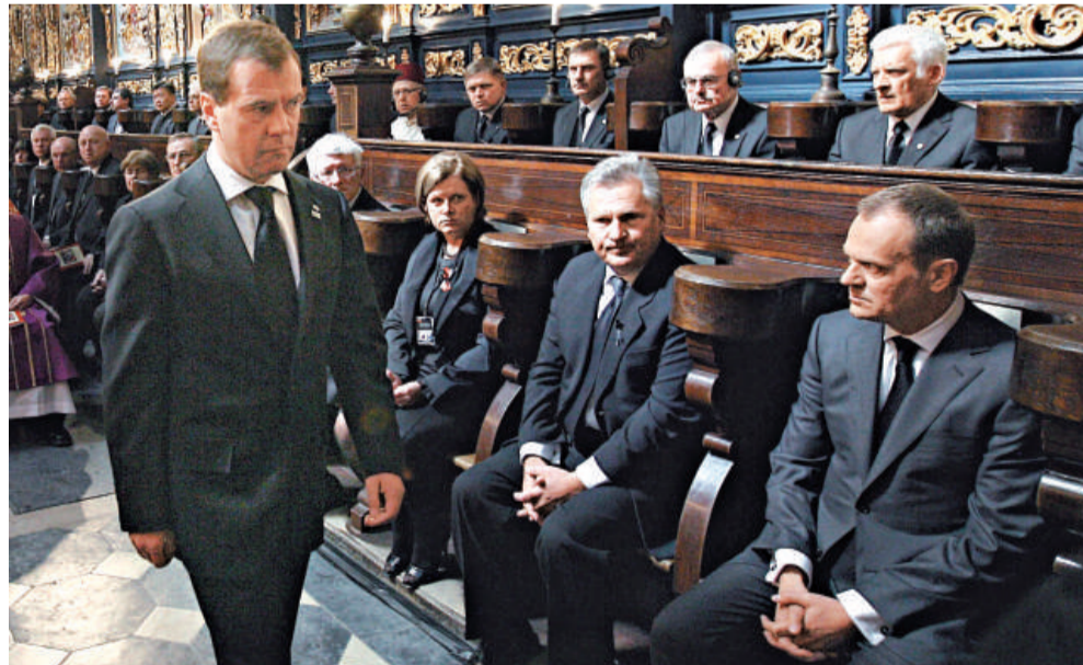
俄羅斯總統梅德韋傑夫（左）參加卡欽斯基的葬禮，右為波蘭總理图斯克

一九四〇年，蘇聯秘密警察在卡廷森林屠殺二萬二千名波蘭官兵。但是，卡欽斯基的死亡悲劇，以及這場悲劇恰恰發生在卡欽斯基前往俄羅斯參加紀念卡廷大屠殺的儀式途中，也許會留下新的歷史遺產。