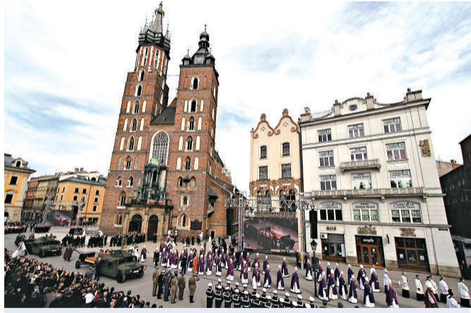
波蘭總統的長眠之地：瓦維爾城堡的一座教堂。圖為民眾在一旁觀看葬禮

克拉科夫一直是一個享有自治的獨立小國，十九世紀中期才被奧地利人掌管。由於他們的統治作風相對溫和，容許波蘭人將他們的英雄葬於那座大教堂內，結果它成了一座國家萬神殿。