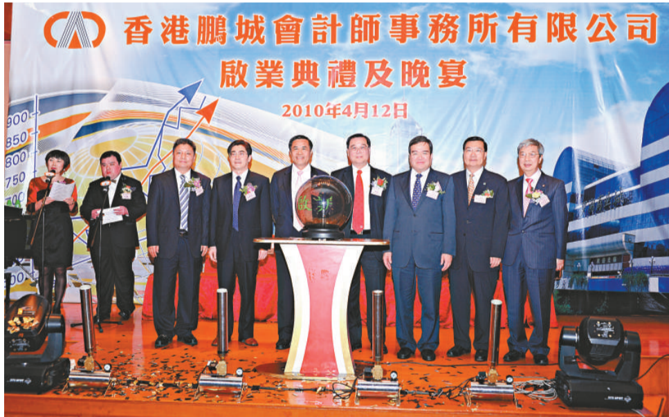
▲啟業禮上，賓主合影

該晚到賀嘉賓官紳雲集，香港證券及期貨事務監察委員會主席方正；商務及經濟發展局副局長蘇錦樑；立法會議員(會計界)陳茂波；入境事務處處長白韜六；港區全國人大代表吳亮星；港區全國人大代表雷添良；公司註冊處處長鍾麗玲；消防處處長盧添雄；消防處處長郭晶強；衛生防護中心總監曾浩輝；民安隊處長李樹榮；醫療輔助隊隊長官聯會主席劉漢華；黃林梁郭會計師事務所梁光建；和記黃埔地產總物業經理陳志球；醫療輔助隊總參事陳耀榮；中聯辦協調部處長蔡文豐；民安隊總參事暨民安隊副處長廖志強；香港會計師公會會員及公會事務總監譚錦章；東區區議員馮翠屏等，以及廣東