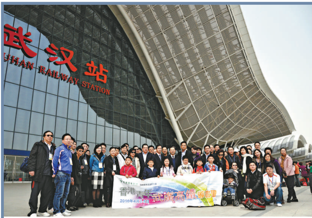
▲香港青年武廣高鐵導賞團合影