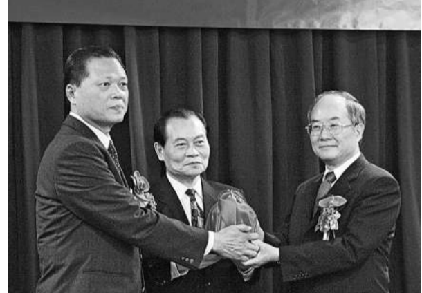
島內最高法院檢察署檢察總長交接儀式於19日舉行，在「法務部長」曾勇夫(中)監交下，代理檢察總長林偕得(左)交接給新任檢察總長黃世銘(右)。