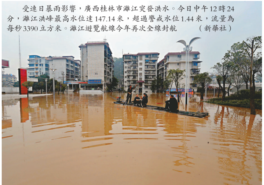
受連日暴雨影響，廣西桂林市濠江突發洪水。今日中午12時24分，濠江洪峰最高水位達147.14米，超過警戒水位1.44米，流量為每秒3390立方米。濠江遊覽航線今年再次全線封航