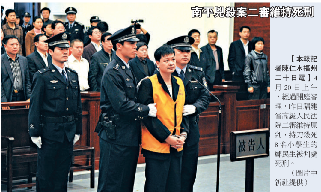
南平總緝案二審維持死刑

根據福建省委常委會最新公布的人事調整安排：晉江市委書記楊益民調福州任常務副市長，在福州常務副市長任上多年的梁建勇則調任莆田市長，而晉江市長尤猛軍升任晉江市委書記。(本月八日，莆田原市長張國勝突然跳樓身亡。)此外，寧德市長陳家東調任省林業廳廳長(傅林業廳原廳長吳志明被雙規)；泉州市委副書記、常務副市長廖小軍接替陳家東任寧德市長；自南平市長龔清概赴任平潭綜合實驗區黨工委書記、管委會主任之後，南平市長一直空缺，今天會議公布廈門副市長婁金佳調任南平市長；泉州豐澤區委書記許維澤轉任石獅市委書記，安溪縣縣長陳燦輝任豐澤區委書記。