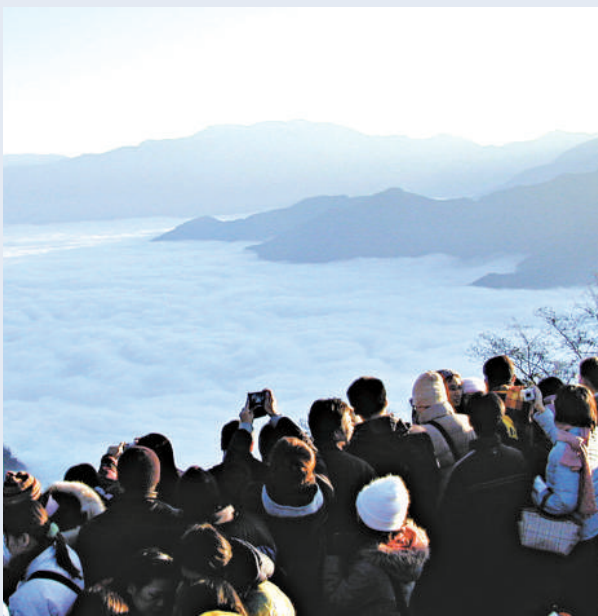
阿里山的風景雖美，但山路險惡，頻生意外（資料圖片）

中埔警分局交通事故處理小組警員曾多次警告，台 18 線彎道多，且易起霧，視線不佳，從觸口以上全線受限 30 公里且規定開頭燈，遊客到阿里山旅遊，最忌疲勞開車，若要上山欣賞日出，最好在山上過夜，不要倉促趕路。