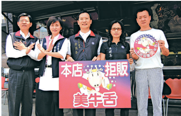
是否進口美國牛舌在島內引發爭議，台中市議員 20 日在台中市 1 家牛排店前與業者一起向美國牛舌說「不」

台灣教育部長吳清基認為，有關法案在「立法院」本會期一定會過，至於綠營立委揚言阻擋，吳清基說，民進黨立委私下也講，大陸學生來台沒有想像中的問題，也知道法案會過，只是礙於政黨立場而反對。