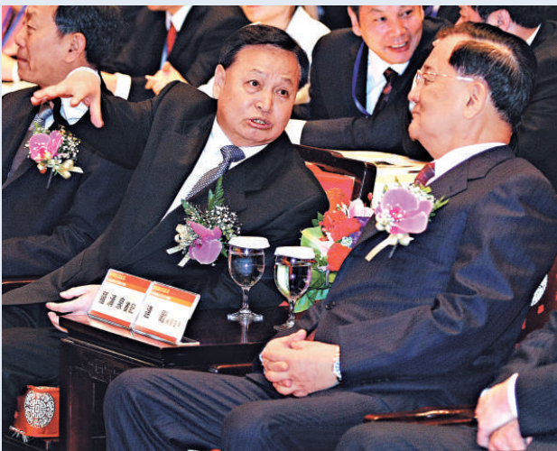
國民黨榮譽主席連戰（前右）與湖北省委書記羅清泉（中），20 日出席台灣湖北（武漢）周開幕式暨 2010 台鄂經貿文化交流與合作論壇時交換意見

台灣湖北（武漢）周 20 日上午在台北圓山飯店揭幕，國民黨榮譽主席連戰表示，當年孫中山先生在建國大綱中，要把武漢地區建立成為中國的芝加哥，他本人在芝加哥待了 6 年之久，與當前的武漢非常相近，當年的夢想，現在可說已經逐一實現。