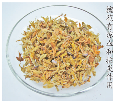
槐花有涼血和抗炎作用

500毫升，煎煮至200毫升後，取出雞蛋，剝去蛋殼後，放回再煎片刻便可。每日1次，飲湯吃蛋。此法可治鼻炎、鼻竇炎等引起的鼻塞頭痛等症。