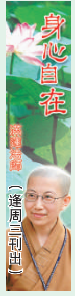
身心自在 星雲大師 (逢周三刊出)

「平常一樣窗前月，才有梅花便不同。」生命裡的忙碌、緊張，從禪的智慧、幽默中，增添了自在與歡喜，希望每個人都能開發自我內心的悟性，自能於事項中以清明的智慧處事，尤其是面對紛擾的環境，亦能處之泰然，隨緣生活。