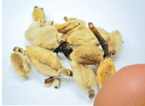
辛夷花茶煮雞蛋 可作鼻塞頭痛食療

辛夷花又名望春花，性溫、味微苦辛。《本草綱目》指出，辛夷花善治「鼻淵，鼻軌，鼻塞，鼻瘡及痘後鼻瘡」。研究表明，辛夷含揮發油，對常見皮膚真菌有抑制作用，並能收縮鼻黏膜血管，為治鼻淵頭痛、鼻塞不通、不聞香臭、常流濁涕症的要藥。治急性或慢性鼻炎、過敏性鼻炎、肥厚性鼻炎、鼻竇炎、副鼻竇炎等，均有一定療效。