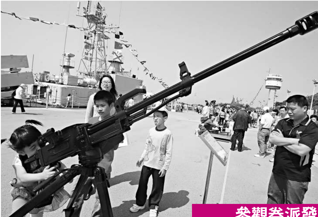
每次解放軍駐港部隊開放軍營，都吸引大批市民到場參觀（資料圖片）

今次軍營開放計劃向本港市民和社會團體發放參觀券共二萬四千張，昂船洲軍營、石崗軍營、新圍軍營各八千張。