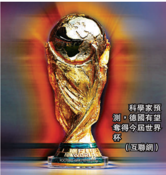
科學家預測，德國有望奪得今屆世界杯