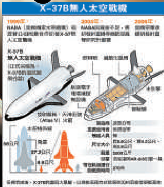
美國空軍的X-37B是以X-37為原型，被稱之為「軌道試驗飛行器1號」