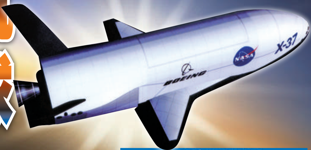
X-37進入太空的想像圖

【本報訊】綜合外電華盛頓二十一日消息：電影《星球大戰》中，戰機在太空中戰鬥的場景也許不久就會實現！美國空軍一架被列為最高機密的X-37B無人太空戰機，二十二日將在佛羅里達州首次升空試飛。外界質疑，X-37B不單純是可重複使用的太空戰機，而是美國甘願裁減核武後的秘密武器，它可在兩小時內攻擊地球任何目標的太空戰機，比核彈還危險。