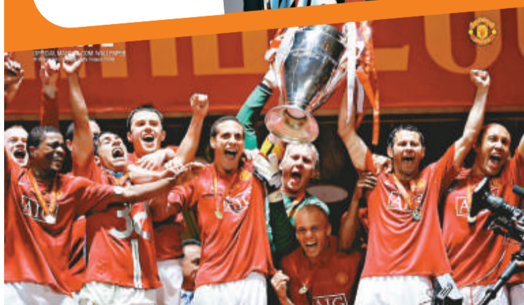
曼聯是全球最值錢的球會 (互聯網)

10 謝拉特 年賺：1500萬美元 年齡：29 國籍：英國 球會：利物浦 主要贊助：Adidas