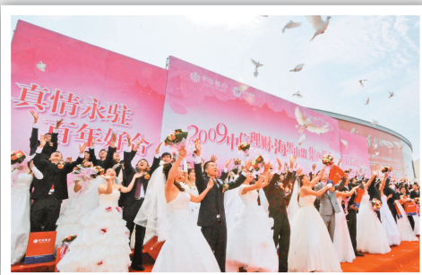
隨著經濟獨立和社會地位提高，結婚已非女性的必然歸宿

《2009中國婚姻狀況調查報告》指出，40%內地單身女性擔心嫁不出去，但憂慮娶不到妻子的男性卻只有8.1%。調查亦發現，內地單身男女戀愛經驗過少，一半人拍拖次