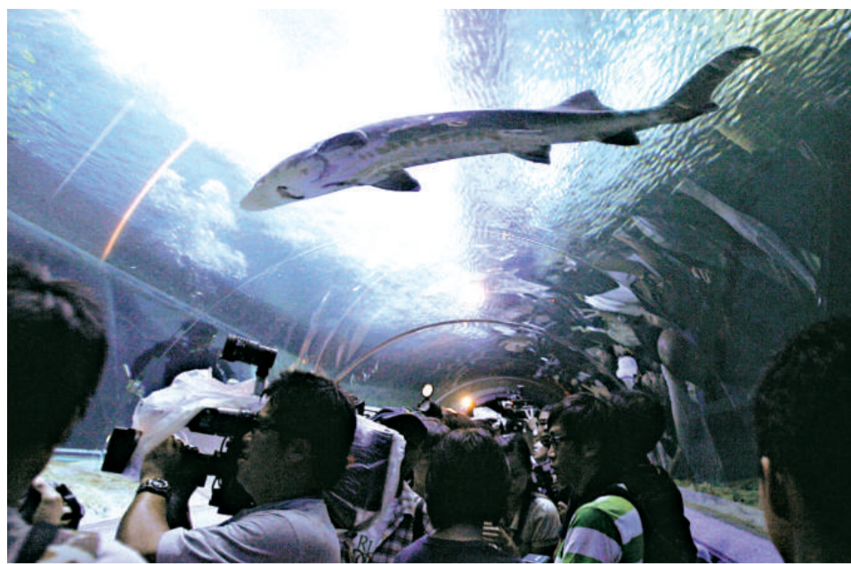
內地贈港中華鱘因「水土不服」半年死三條，海洋公園已將中華鱘館改建，盼能令牠們安居。圖為中華鱘館開幕時的圖片（資料圖片）