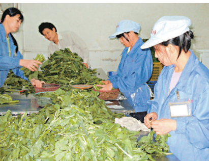
番禺輸港蔬菜基地將試行標籤制度

檢驗檢疫局官員表示，此舉實現供港蔬菜流轉中的每一管理環節的上下游追溯，實現管理者對蔬菜從原料、生產、運輸到銷售全過程的了解和把握，全面實現了供港蔬菜全過程、無縫隙監管。