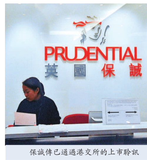
保誠傳已通過港交所的上市聆訊

夏佳理又指，到內地市場的推廣工作將集中由港交所行政總裁李小加負責。他坦言交易所間的競爭一直存在，尤其在港掛牌的內地企業，亦會考慮在上海或者深圳上市，而競爭亦