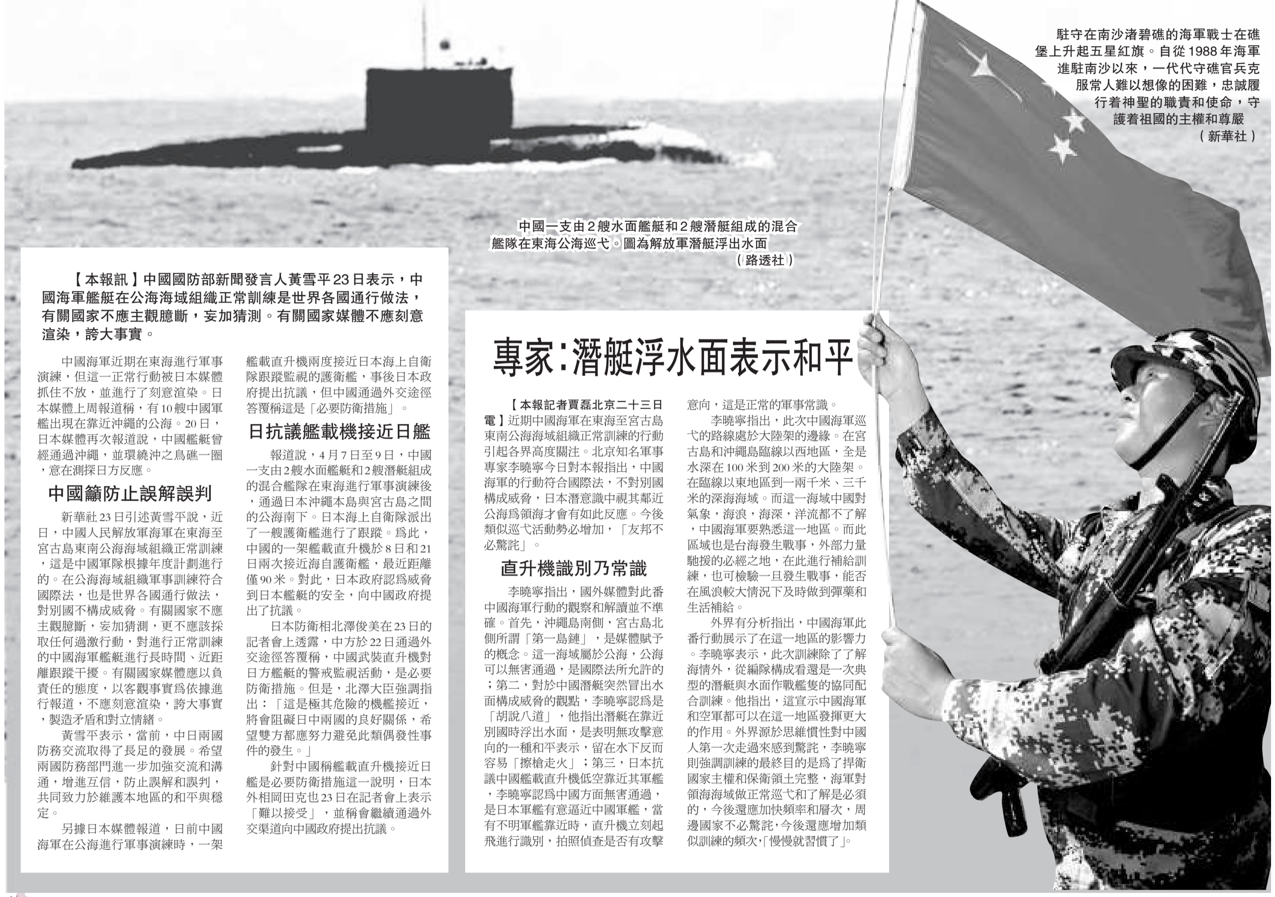
駐守南沙渚碧礁的海軍戰士在礁堡上升起五星紅旗。自從1988年海軍進駐南沙以來，一代代守礁官兵克服常人難以想像的困難，忠誠履行着神聖的職責和使命，守護着祖國的主權和尊嚴。（新華社）