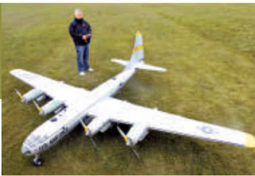
這隻遙控玩具機翼展長約二十英尺