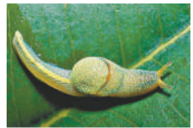
這隻綠黃相間的鼻涕蟲也是新品種之一

這裡發現的竹節蟲長達半米，是世界上最長的竹節蟲。它是在馬來西亞沙巴地區納納山公園發現的，到目前為止，科學家只發現了這種物種的三個標本。與其他竹節蟲類似，這種昆蟲可以偽裝成嫩枝，即使它們活動的時候，也能很好地保持偽裝，就像嫩枝隨風搖動一樣。