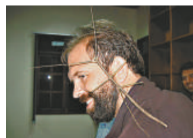
婆羅洲新發現的竹節蟲長達半米

綠黃相間的鼻涕蟲是在馬來西亞沙巴地區海拔1900多米的山區森林中發現的。鼻涕蟲用尾巴運動，它的尾巴比頭長兩倍，而頭被4厘米長的身體纏繞。火焰蛇（柯普斯坦氏過樹蛇）體長約1.5米，其頸部是鮮豔的橙色，並伴有彩虹色、藍色、綠色以及褐色條紋，一直延伸到身體後背上。