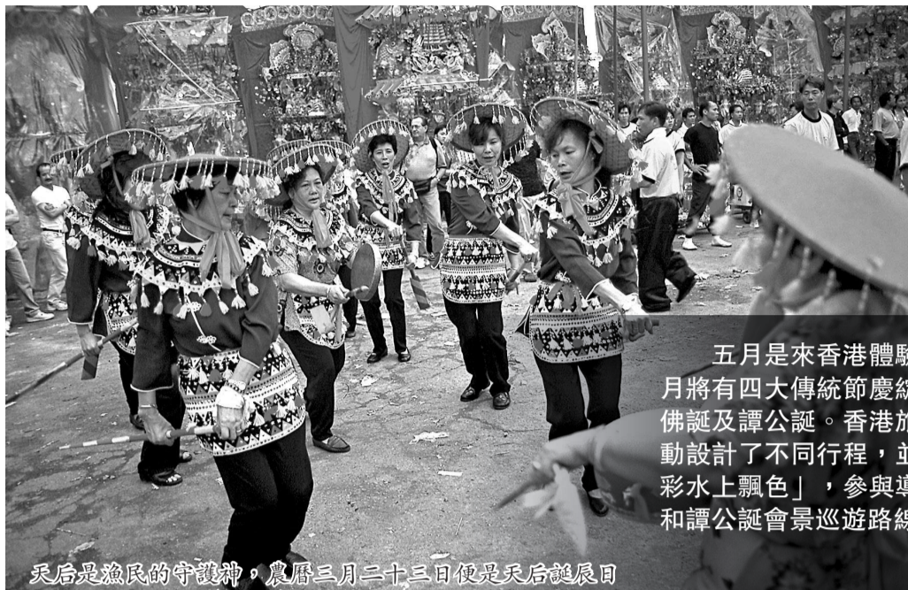
天后是漁民的守護神，農曆三月二十三日便是天后誕辰日

「香港傳統文化匯」是旅發局「香港節慶年」的首個推廣階段，下月六日起至二十二日，向訪港旅客推介五月在本地舉行的四大傳統節慶。旅發局與旅行社合作，推出的節慶觀光賞團，今年加入更多新元素，讓訪港旅客有更強的參與感。