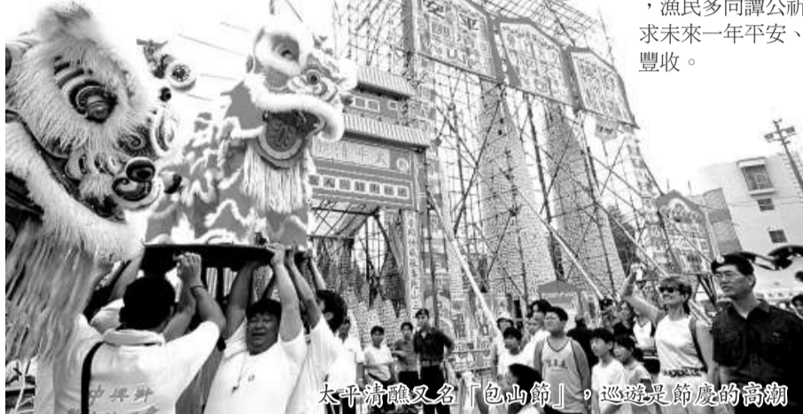
太平清醮又名「包山節」，巡遊是節慶的高潮

農曆四月初八，相傳是釋迦牟尼的誕生日，故此日為佛誕，又稱「浴佛節」，當日香港主要的佛教寺廟都會舉行盛大慶祝活動。擁有全世界最高戶外青銅坐佛的大嶼山寶蓮禪寺，是禮讚膜拜的重地之一，善信可參與浴佛儀式，及享用美味齋菜。譚公是另一位海上的守護神，為漁民帶來平安與喜樂。慶典儀式與天后誕相似，漁民多向譚公祈求未來一年平安、豐收。