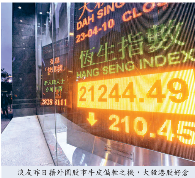
淡友昨日藉外圍股市牛皮偏軟之機，大殺港股好倉

細價股炒風持續，周四大漲58%的創新能源（00702），昨日再升25%，收0.49元。中華國際（01064）則升57%，收1.1元，是升幅最大港股。周四會大漲1.49倍的華信地產（00252），股價則回軟，跌16%，收2.16元。