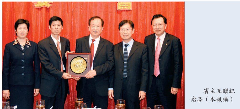
賓主互贈紀念品 (本報攝)