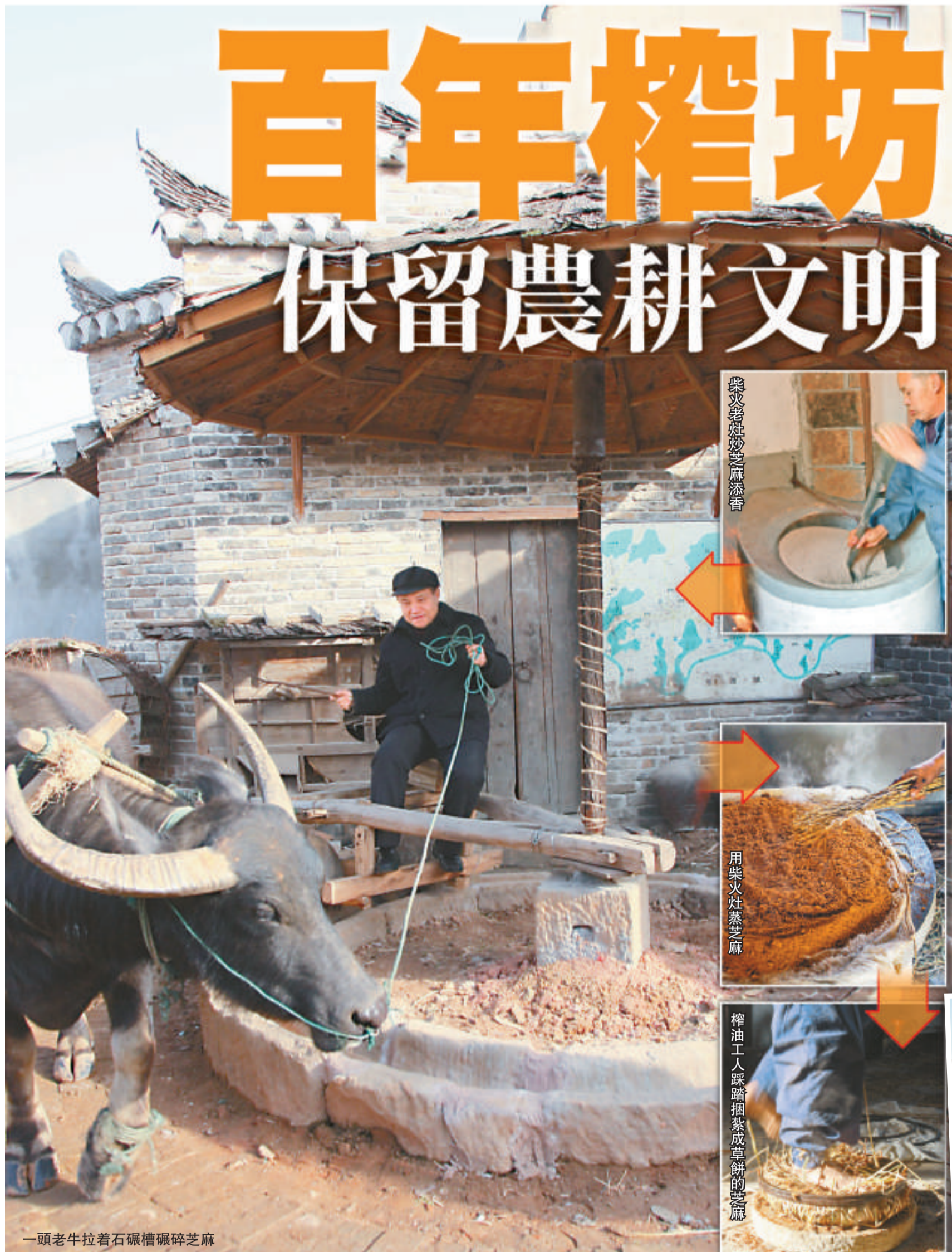
一頭老牛拉着石碾碾碎芝麻