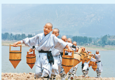
▲少林寺小沙彌提水（資料照片）