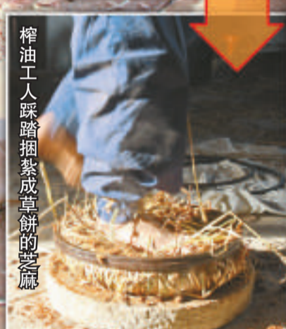
榨油工人踩踏搗成草餅的芝麻

盤龍城位於武漢北部，起源於3500年前，被稱為「武漢之根」。盤龍城楊樓子灣楊氏古榨坊，則起源於1558年（明嘉靖年間），所產壽康坊小麻油曾為明皇宮貢品。這個百年芝麻油老榨坊不僅給記者帶來傳統的懷舊感覺，更有絲絲寧靜縈繞心頭。