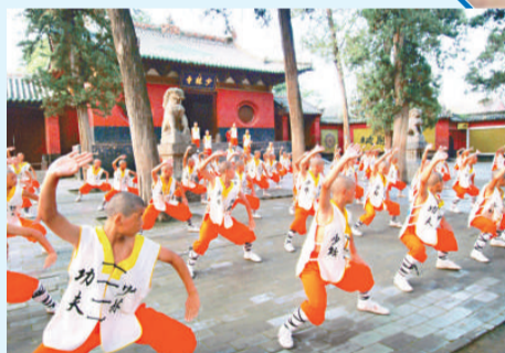
▲少林僧人在演練功夫（資料照片）