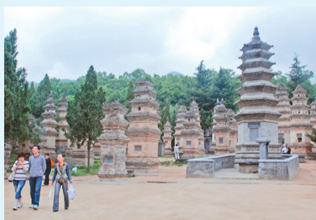
▲少林寺塔林（資料照片）