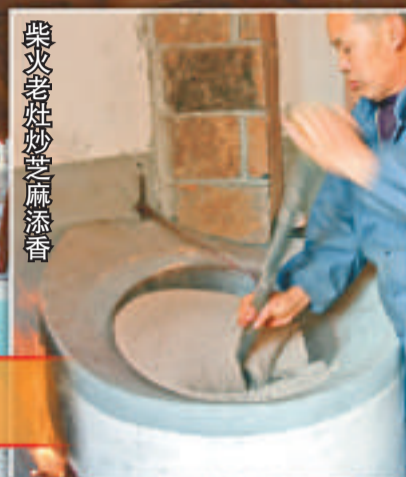
柴火老灶炒芝麻添香