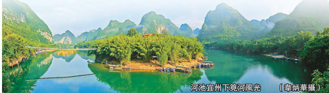
河池宜州下覽河風光

河池市還舉辦「一縣一節，一月一節」旅遊節慶活動，巴馬國際長壽文化旅遊節、中國白褲瑤民俗文化旅遊節、河池市銅鼓山歌藝術節、神奇洞穴國際探遊節等，促進當地旅遊招商引資、品牌知名度和綜合服務的提升。