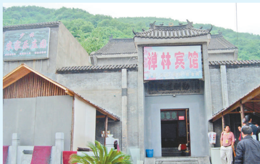
►離少林寺不遠的農家院