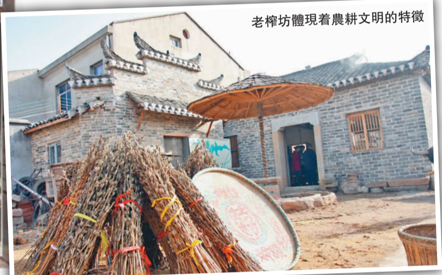
老榨坊體現着農耕文明的特徵

「儘管由於現代化的推進和政治上的變化，這些傳統文化面臨挑戰，但它傳承和弘揚的希望還是在民間」。羅時漢指出，黃陂楊樓子榨坊的復建，既體現了當地政府的開明，也表現了本土農民的覺悟。有了這種合力，文化遺產保護才可能真正成為現實。