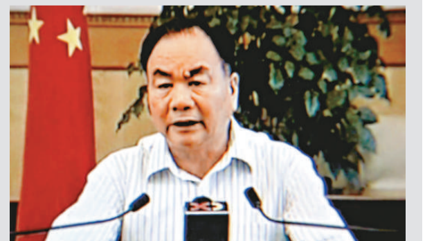
二〇〇九年七月七日，時任新疆維吾爾自治區黨委書記王樂泉就烏魯木齊「七·五」打砸搶燒嚴重暴力犯罪事件發表電視講話 (資料照片)