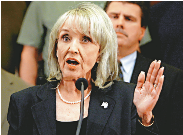
美國亞利桑那州女州長布魯爾二十三日簽署了一項具爭議性的移民法案

【本報訊】據美聯社鳳凰城二十四日消息：美國亞利桑那州女州長布魯爾二十三日簽署一項具爭議性的移民法案，授權警察決定一個人在美國是否合法，如果懷疑某人是非法移民，可以進行盤問。法例還要求民眾在任何時間都要隨身攜帶永久居留證或護照。至少兩個倡議團體都表