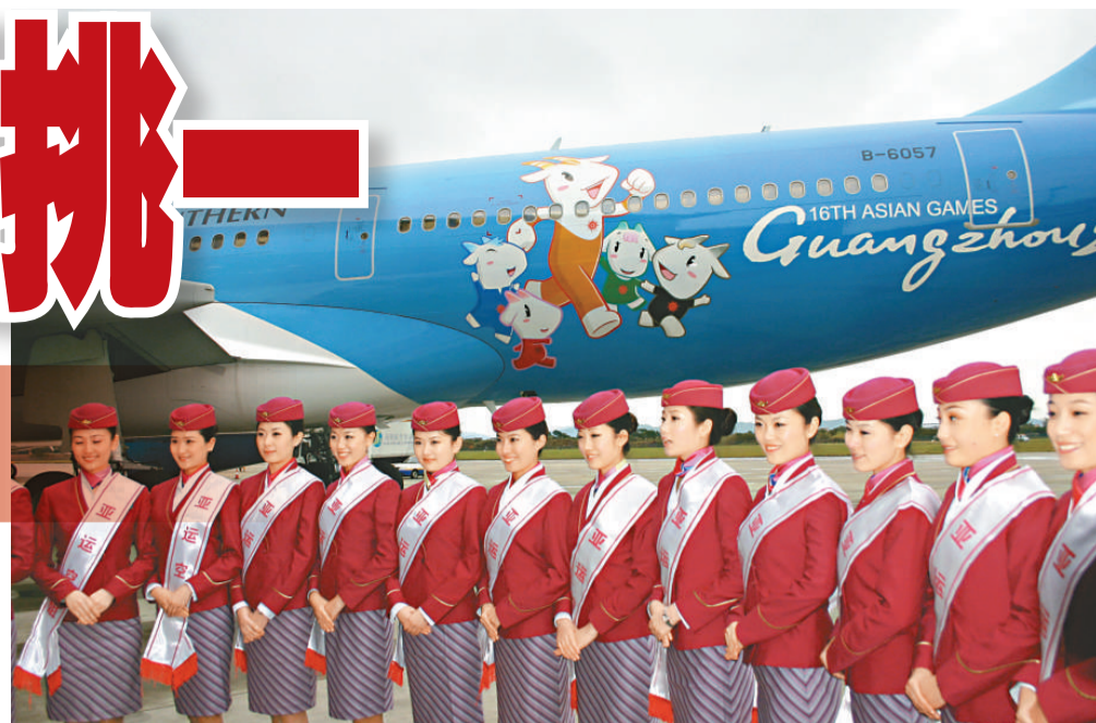
▲彩繪着廣州亞運會吉祥物「五羊」的南航「亞運號」專機，與首批「亞運空姐」一同亮相。專機將承擔運送亞運會聖火的重任

作為亞洲客運量第 1 的航空公司，南方航空去年中便攜手廣州亞運會組委會首次提出「亞運空姐」概念，啓航「中國亞運空姐招募大匯」，引領中國空乘招聘新風潮。當時開設武漢、瀋陽、長沙、廣州、南京、北京及烏魯木齊 7 選區，人氣火爆、美女如雲，幾乎每選區都吸引 8000 名選手參與競逐，最終 339 名脫穎而出。