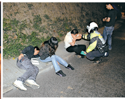
▲傷者坐在路邊等待救援