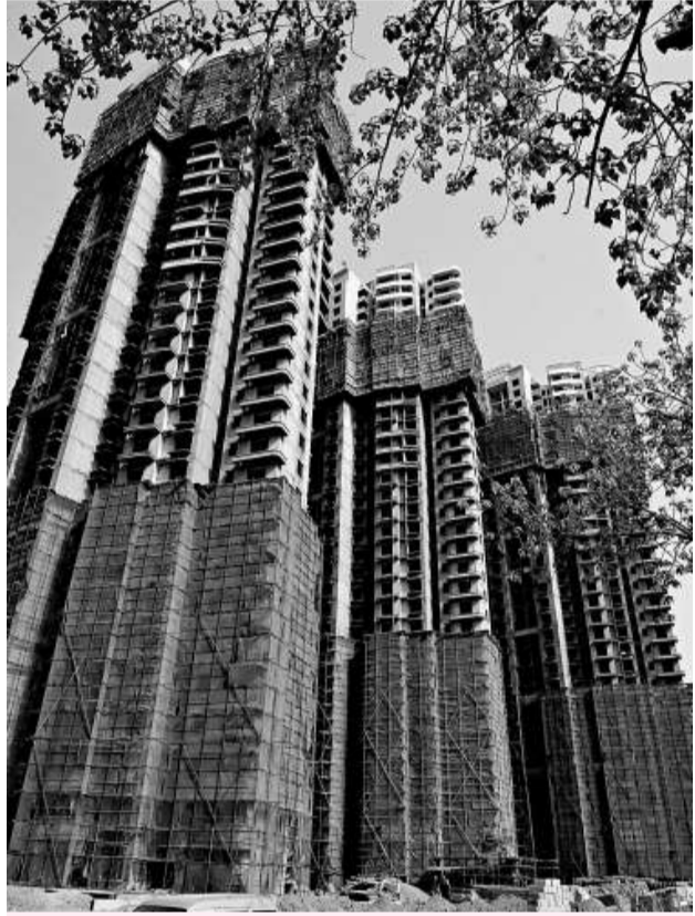
因中國住宅產業化程度不高，加之設計、建造、維護管理等原因，住宅壽命只有30年，大大低於發達國家的住宅使用壽命。

「中國應學習國外的建築理念，借鑒「日本模式」，轉變住宅建設的發展模式，並結合實際情況，探索出一條適合我國國情的百年住宅建築體系。」劉志峰說。