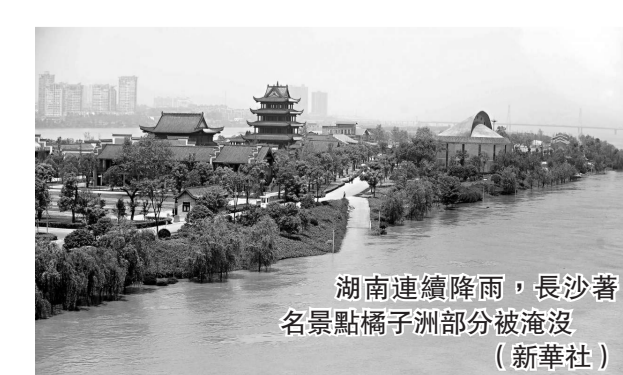
湖南連降大雨，長沙著名景點橘子洲部分被淹沒。

有效減輕了下游防汛壓力。 24日凌晨1時，湘江長沙站洪峰水位36.23米，超警戒水位0.23米，這標誌着湘江今年首次超警戒水安全通過。由於沿線幹部群衆嚴密防守，此次洪水沒有出現大的險情，最大限度地減輕了災害損失。不過據湖南省氣象台預計，24日晚到25日全省將迎來新一輪中強度降水天氣，局部有大到暴雨出現。強降雨可能導致江河水位再次上漲，防汛形勢加峻。