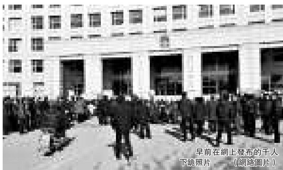
早前在網上發布的千人下跪照片。

大連市委、市政府同時決定，由大連市紀委、公檢法等部門組成督查組，指導和督查莊河市相關工作進展情況。