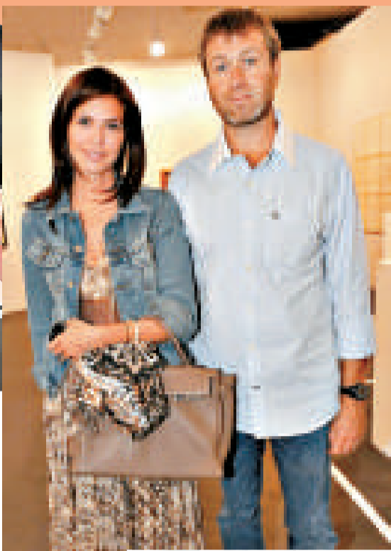
▶身家居英國第二位的阿巴莫域治與他的女友