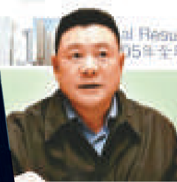
▲香港商人劉鑾雄 (資料圖片)