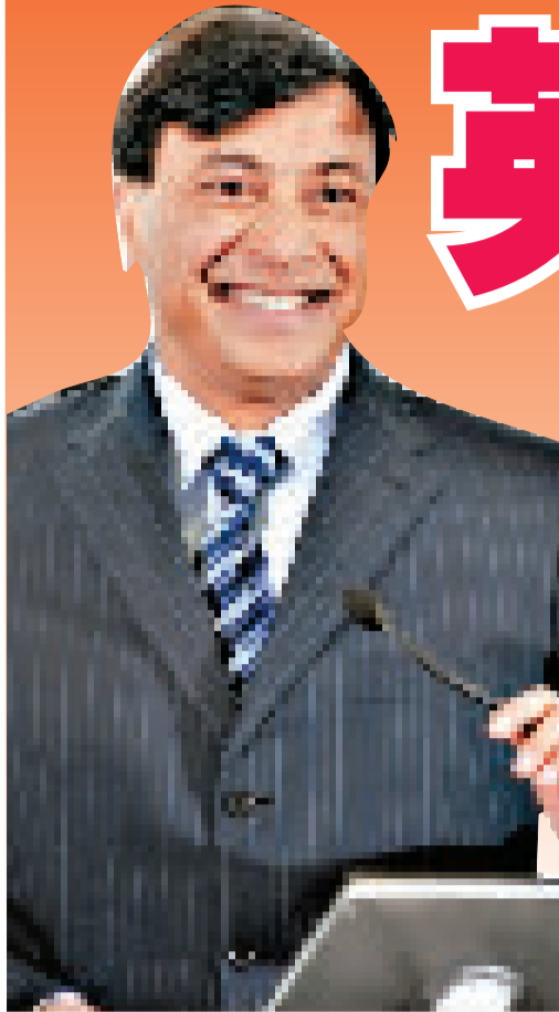
▲蟬聯英國首富的鋼鐵大王米塔爾 (資料圖片)