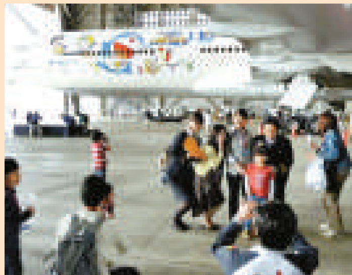
▼日本一家人在「多啦A夢」飛機前合影