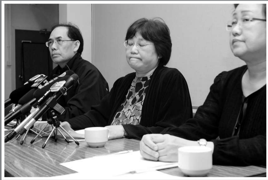
▲校方對女教師墮樓身亡表示哀傷