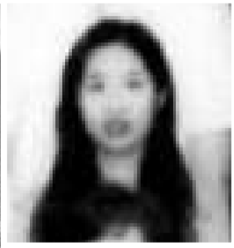
女教師由學校4樓墮下身亡