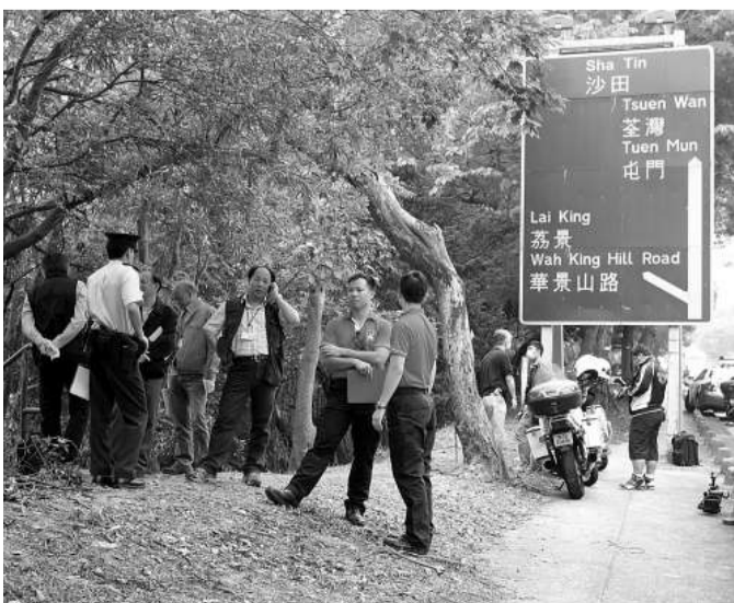
▲發現人類骸骨的青山公路葵涌段現場

【本報訊】一批土木工程拓展署人員早前到葵涌一處險要斜坡視察時發現懷疑人骨，昨晨報警求助，警方高空搜查隊奉召到場游繩協助開路，讓深水埗警區重案組探員前往現場調查，死者身份仍待進一步確定。