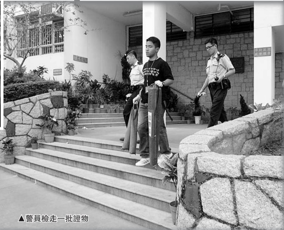
▲警員檢走一批證物