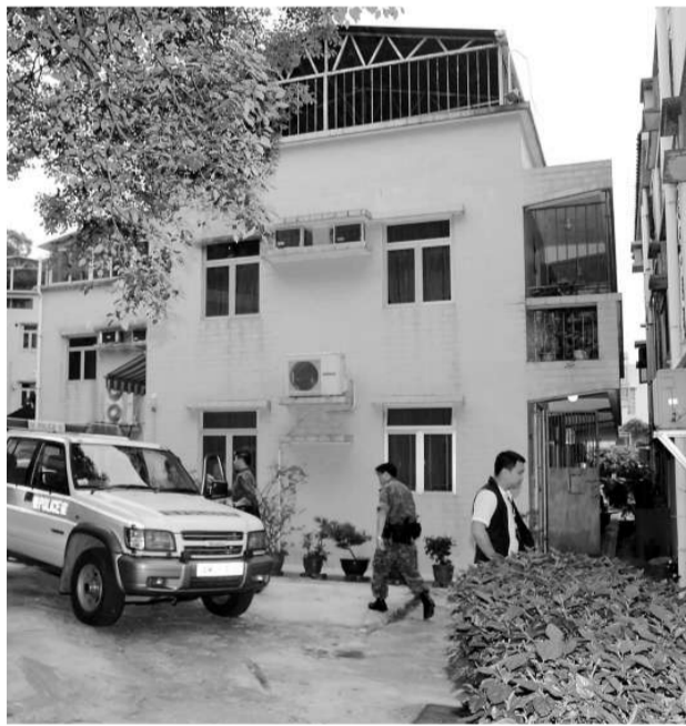
▲警方昨天再度搜查粉嶺大埔田村涉案村屋