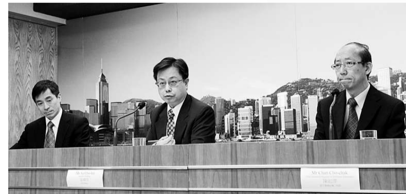
▲(左起)屋宇署助理署長許少偉、屋宇署署長區載佳、屋宇署總結構工程師陳祖澤發表馬頭圍道樓宇倒塌調查報告及舊樓巡查結果