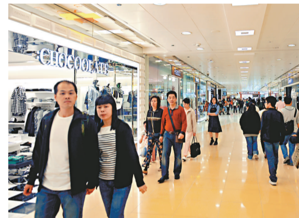
▲ 調查發現，反映未來三個月經濟行為的消費者信心指數下跌，顯示普通市民上街消費的意欲減弱