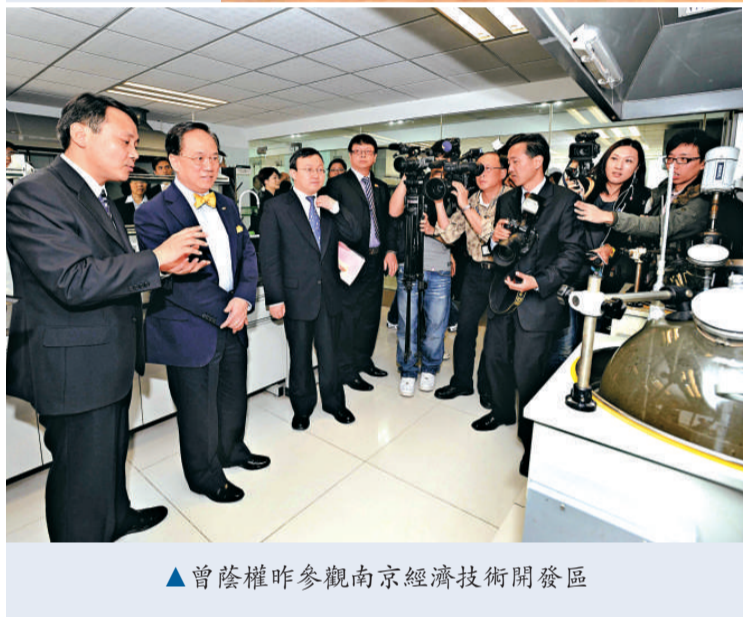
▲ 曾蔭權昨參觀南京經濟技術開發區