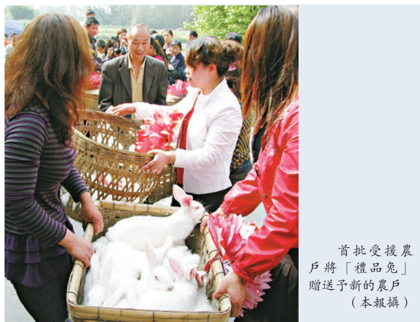
首批受援農戶將「禮品兔」贈送予新的農戶 (本報攝)