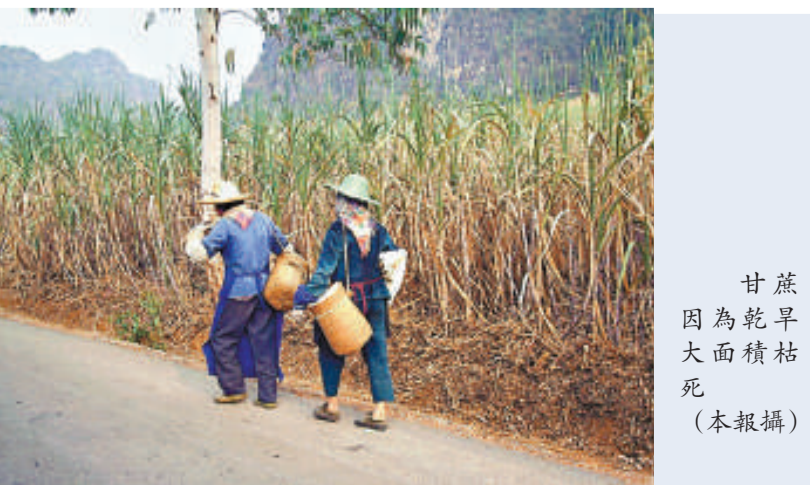
甘蔗因為乾旱大面積枯死

全國前20強也是雲南省大型製糖企業之一的雲南力量物製品集團表示，集團紅河分公司，去年甘蔗原料大概是34萬噸，今年卻只有10多萬噸了，至少減少了一半。甘蔗的收購價由去年的每噸200多元提高到了今年的300多元。旱災不僅影響了入榨量，增加成本，更讓糖企憂心的還有下一年的原料難以得到保證。