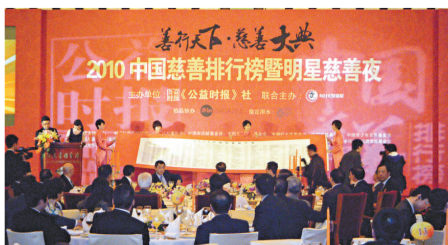
2010中國慈善排行榜榜單在京發布活動現場

資料還透露，人們不知道的是，早在12年前，李瑞環就已立下遺囑：逝世後遺留下來的東西孩子們不能繼承，統統變現資助天津貧困學生。