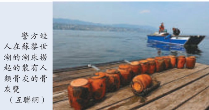
警方蛙人在蘇黎世湖的湖底撈起的裝有人類骨灰的骨灰甕

【本報訊】據英國《每日郵報》二十八日報道：備受爭議的瑞士「尊嚴」(Dignitas)安樂死診所又捲入一宗新醜聞，涉嫌把死者的骨灰當垃圾，胡亂棄置在湖底。