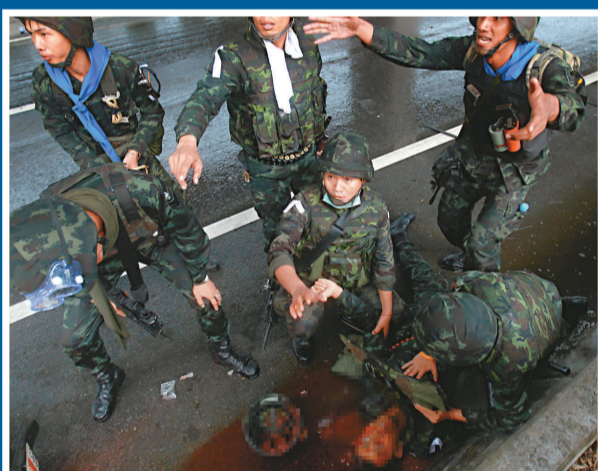
一名軍警頭部中槍重傷不治