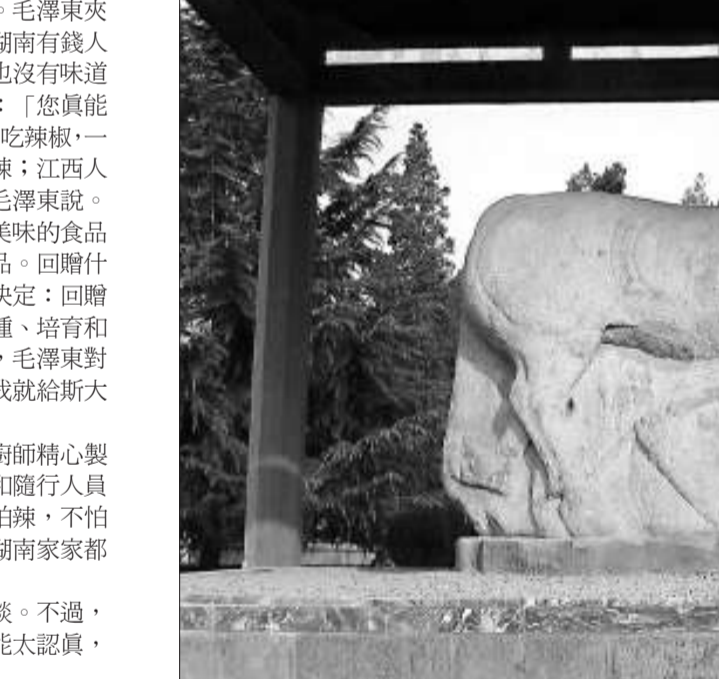
石雕馬踏匈奴

順着這一宗「地鐵上的哲學」，想遠，想開去，越來越覺得若干深刻的思想可由此浮現出來。就拿我們總