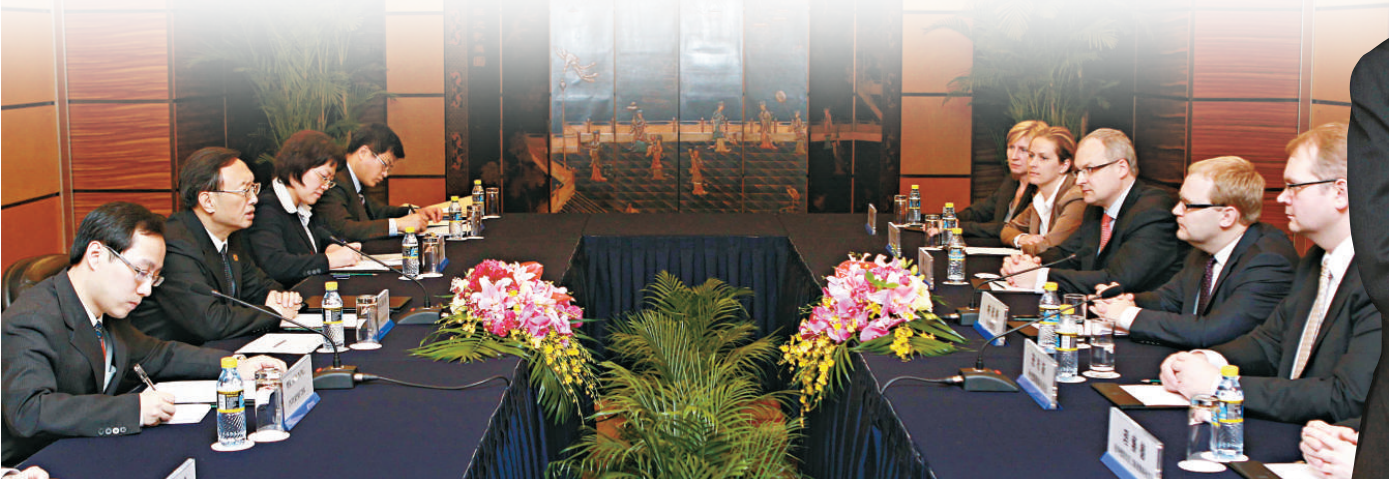
▲各國元首政要陸續抵達上海，29日，外交部長楊潔篪在上海與愛沙尼亞外長佩特舉行會談(左圖)及會見智利外長莫雷諾(右圖)

同時，預計將有約350萬外國遊客參觀世博會。有「浦東趙」之稱的全國政協外事委員會主任趙啟正指出，上海世博會推進中國公共外交事業的又一次歷史機遇，可以幫助世界充分全面了解中國，讓中國最大程度、最接近真實地展現在世界面前。