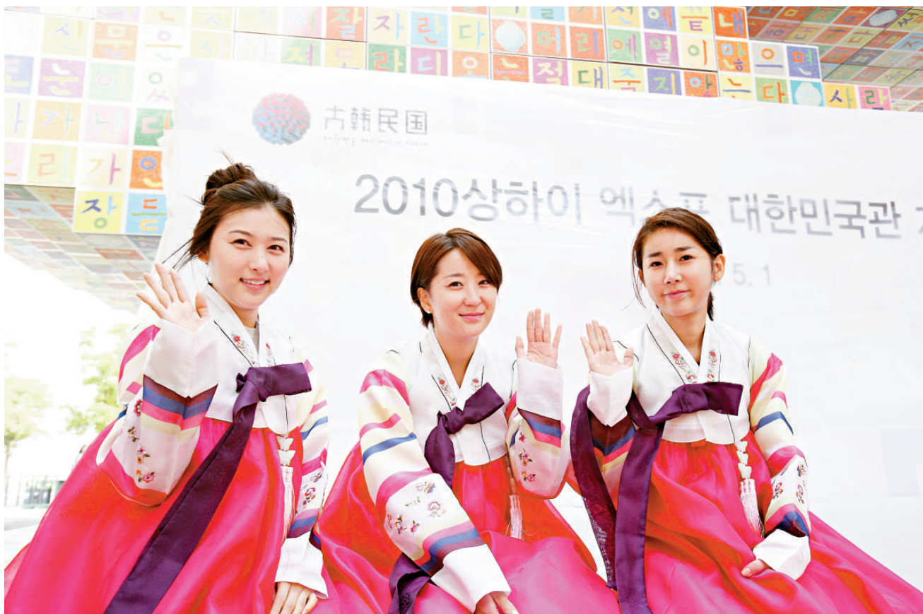
▲世博園各場館正處於最後準備階段，迎接5月1日正式開園。圖為29日，三位身著韓國傳統服裝的禮儀小姐在韓國館參加開館綵排