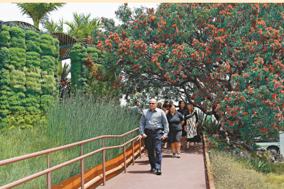
▲29日，新西蘭人舉行隆重的毛利歡迎儀式，在上海世博會開幕前夕「喚醒」新西蘭館。圖為參加儀式的人群行進在新西蘭館的屋頂花園中