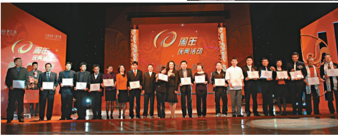
◀俏江南十周年頒獎活動現場