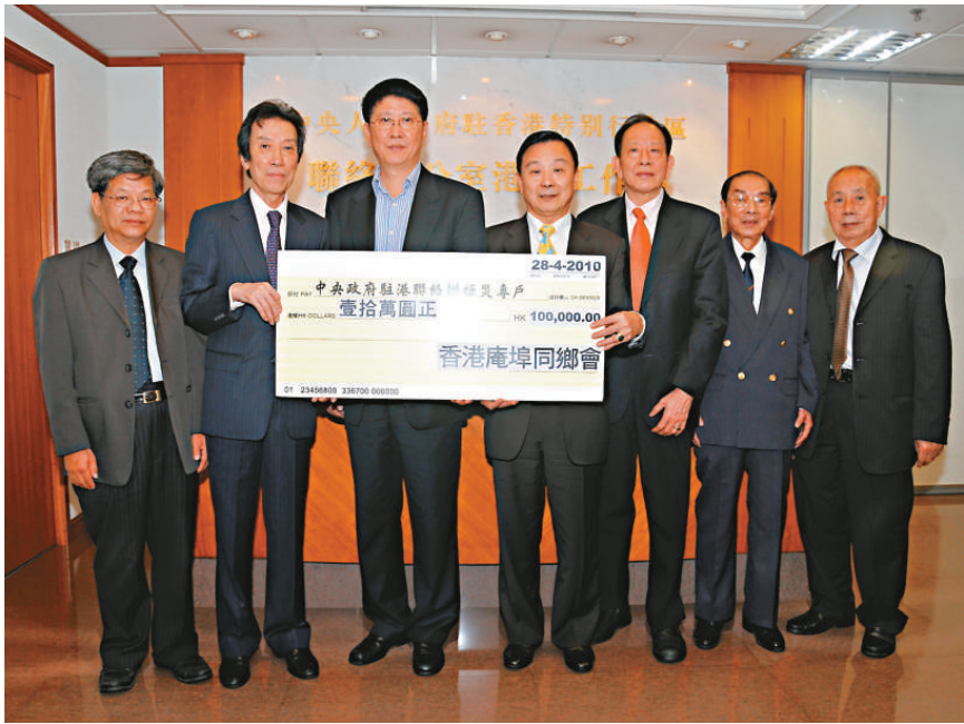
►香港庵埠同鄉會捐款十萬元，中聯辦港島工作部部長吳仰偉接收