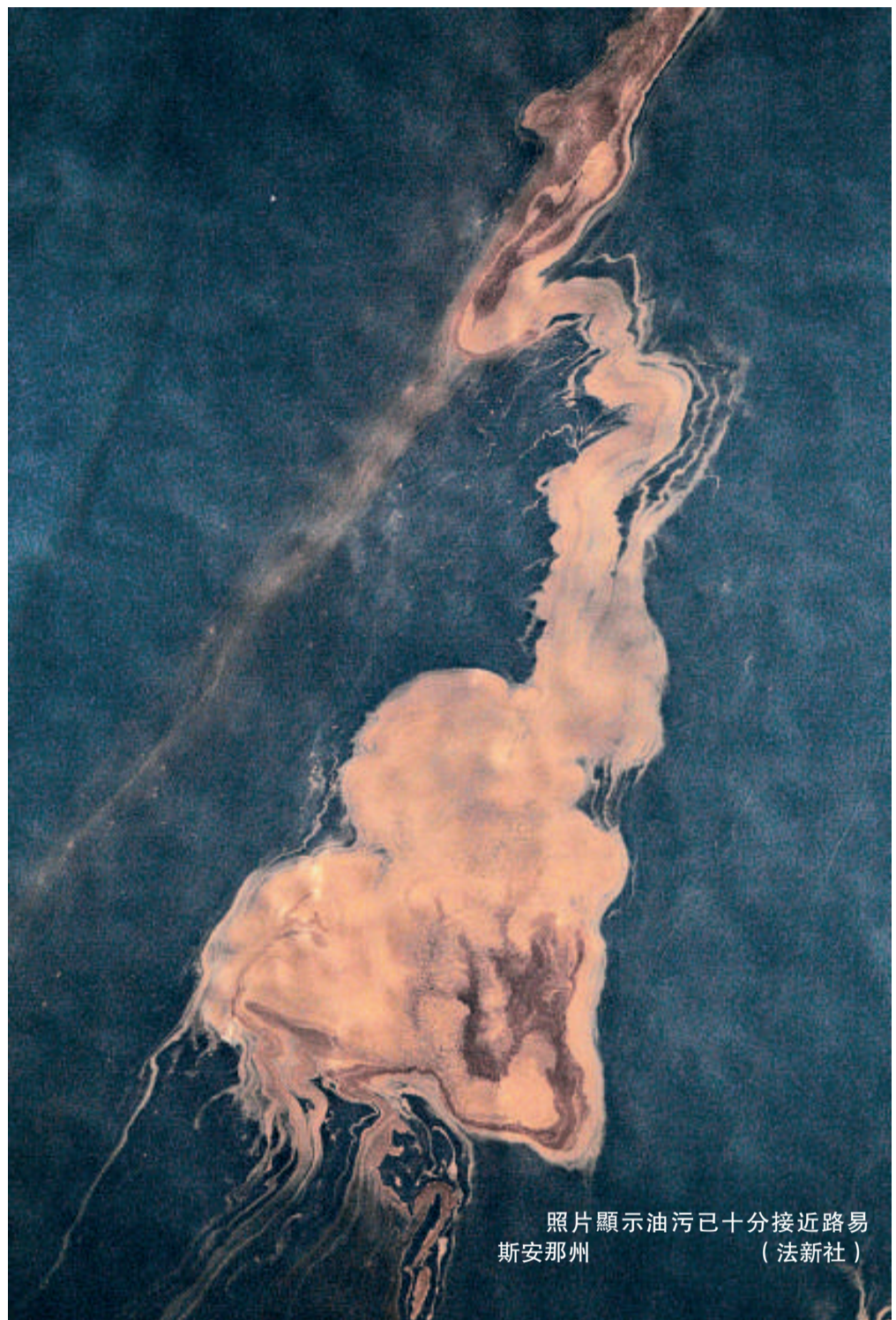
照片顯示油污已十分接近路易斯安那州