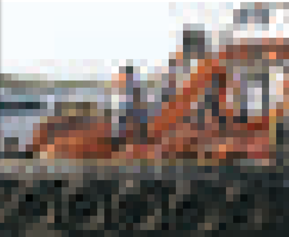
▶美國工人試圖用防水水泡阻礙油污迫近