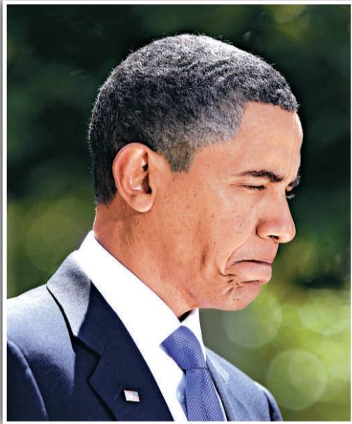
▲奧巴馬保證動用一切資源，制止油污進一步蔓延

事件令人再度關注奧巴馬上月宣布擴大離岸原油開採計劃。佛羅里達州一名參議員已提出議案，要求暫時禁止政府啟動計劃，以免造成生態災難。