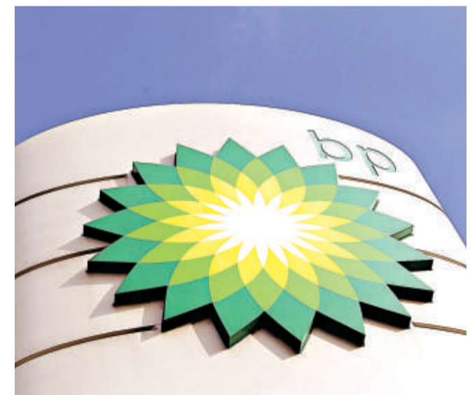
英國石油公司標誌

司是否有盡力確保鑽油工人安全。去年，美國內政部轄下的礦物管理署提出一項議案，要求礦業企業每三年把安全和環境管理的開支提交當局審計，而英國石油是反對的企業之一。還有人向礦管署告發英國石油丟棄了關於其墨西哥灣阿特蘭蒂斯油田鑽油台的重要紀錄，署方已展開調查。