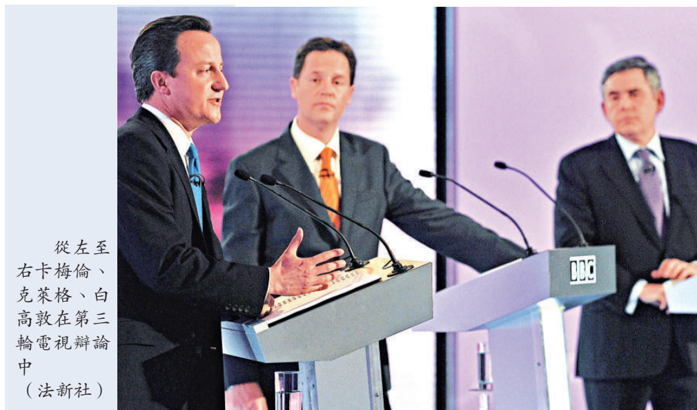
從左至右卡梅倫、克萊格、白高敦在第三輪電視辯論中

【本報記者黃念斯倫敦三十日電】英國三大政黨黨魁二十九日進行大選之前最後一次電視辯論。民調顯示保守黨黨魁卡梅倫得分最高。幾個電視台在辯論結束後對民衆的即時調查發現，至少三分一選民仍然未能決定支持那一政黨，電視辯論可增加選民對黨魁和各黨政策的了解，但不見得有一黨通過電視辯論令大多數選民信服。