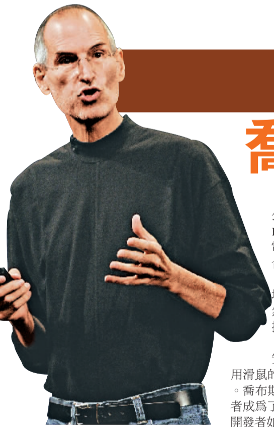
美國蘋果公司行政總裁喬布斯日前罕見地發表公開信，炮轟軟件開發商 Adobe