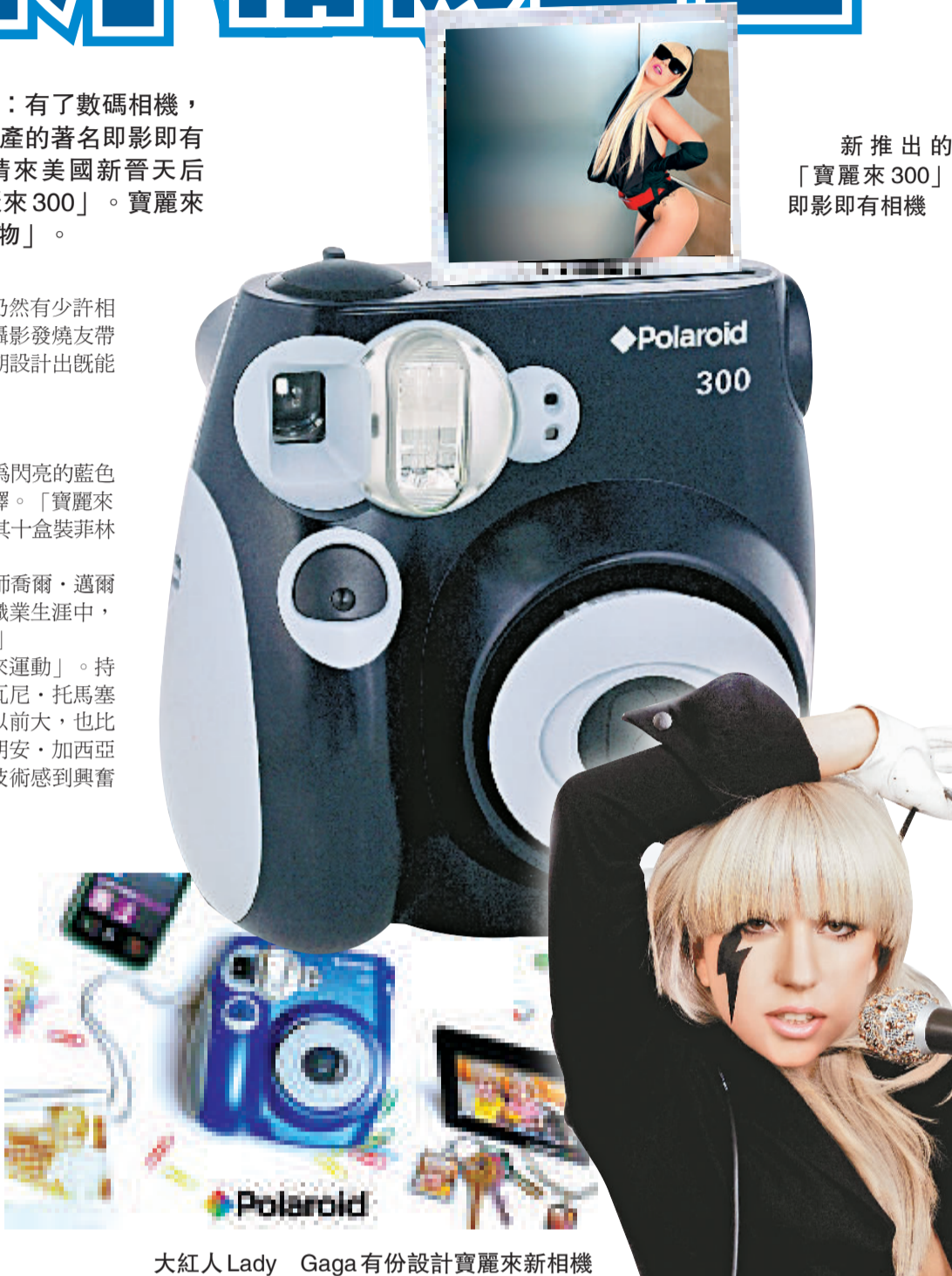
大紅人 Lady Gaga 有份設計寶麗來新相機

然而，隨著數碼相機和具備數碼拍攝功能的手機普及起來，消費者又越來越愛用電腦，寶麗來的需求銳減，其即影即有相機和菲林分別於2007和08年停產，08年公司更被迫申請破產。去年11月，當時的最後一批寶麗來菲林也過了期，似乎寶麗來將步卡式錄音帶和黑膠唱片的後塵，被丟入歷史的垃圾堆。幸而，寶麗來一直極力爭取恢復營運，最終研發出「寶麗來300」。如無意外，其他新產品還陸續有來。