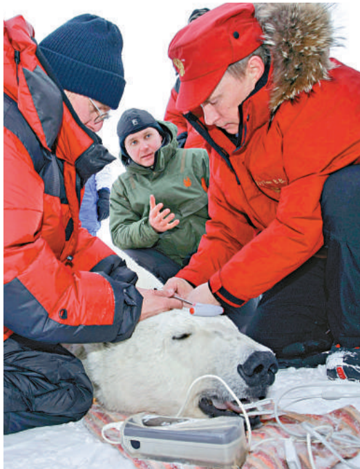
俄羅斯總理普京(右)29日在北極的法蘭士爵瑟夫群島協助科學家追蹤北極熊

長期主宰俄國政壇的普京出身自「克格勃」情報單位，喜歡在鏡頭前展現硬漢形象。他曾赤膊上身釣魚、穿背心騎馬、發行柔道教學 DVD，還曾經拿麻醉槍射擊西伯利亞虎，救了隨行攝影師一命。另外，他曾收過一隻小老虎當生日禮物；不過普京不只對猛獸有一套，他甚至駕駛過俄國 TU-160 長程轟炸機，也曾經搭乘超小潛水艇潛入世界最深的貝加爾湖 1400 公尺湖底，長達 4 個半小時。