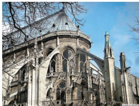
法國教會正面臨「神父荒」

4月20日，法國天主教花費25萬歐元在全國展開了招募神父的活動。這一活動將持續到5月5日。招募神父的廣告上口號這樣寫道：「為何不是我？」他們將向全國發放7萬張展示神父形象的卡片，鼓勵年輕人「讓上帝來做老闆」。為配合招募而在社交網站 Facebook 開設的網頁很受歡迎，一周就吸引了1200人加入並成為「粉絲」。（綜合報道）