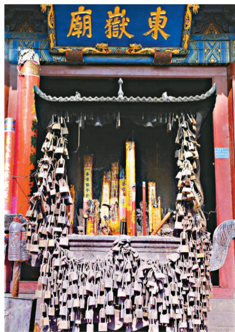
泰山東嶽廟內的香爐上掛滿連心鎖