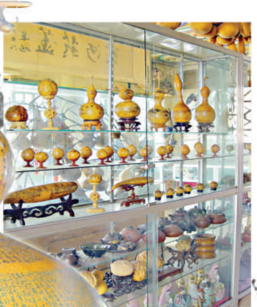
▲櫥櫃裡的刻葫蘆作品 ◀葫蘆作品《金剛經》 ▼陳氏葫蘆閣