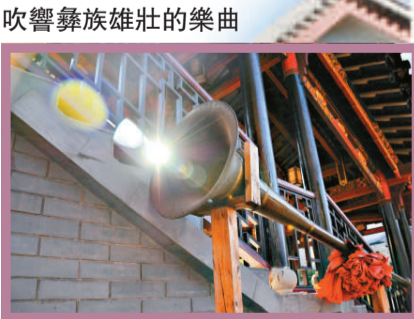
吹響彝族雄壯的樂曲