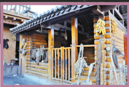
▼彝人古鎮秀甲四方