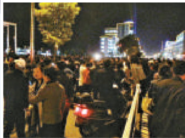
▲泰興千餘名遊行民眾聚集在醫院門前 ▲醫院以電子屏打出字幕緩解民眾情緒