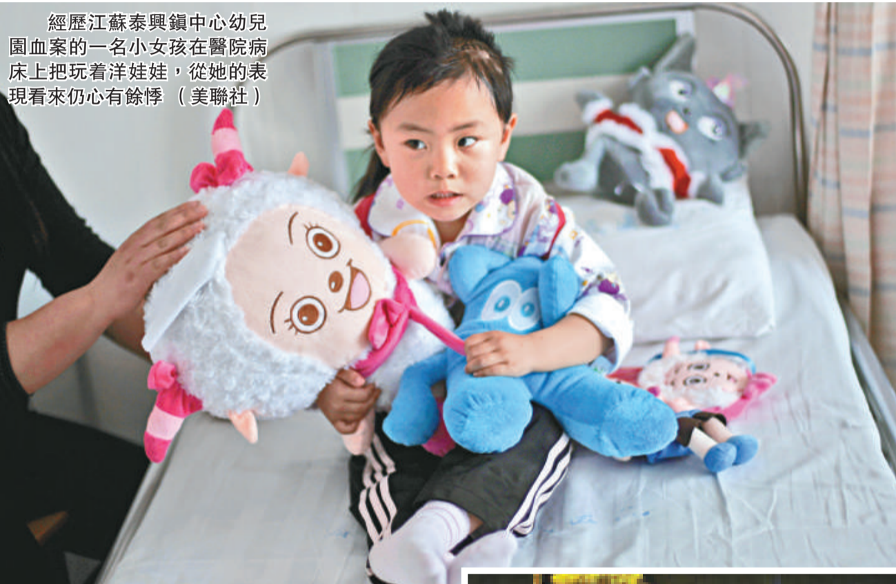
經歷江蘇泰興鎮中心幼兒園血案的一名小女孩在醫院病床上把玩着洋娃娃，從她的表現看來仍心有餘悸。

第四，進一步加大矛盾糾紛排查化解和危險物品管控力度。各級公安機關要深入社區、校園及周邊地區開展矛盾糾紛大排查、大調處活動。對可能影響學校安全的苗頭性、傾向性問題，及時報告黨委、政府，並通報有關部門，採取有效措施予以防範化解；對可能威脅社會治安的高風險人員和危險物品，進一步落實嚴管嚴控措施；積極協助有關部門認真解決好社會閒散青少年就學、就業等問題，從源頭上減少涉校違法犯罪活動的發生。