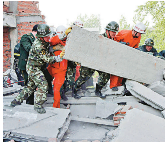
▲▲救援人員在樓房坍塌事故現場展開搜救，被挖掘出來的十名被埋工人確認全部死亡