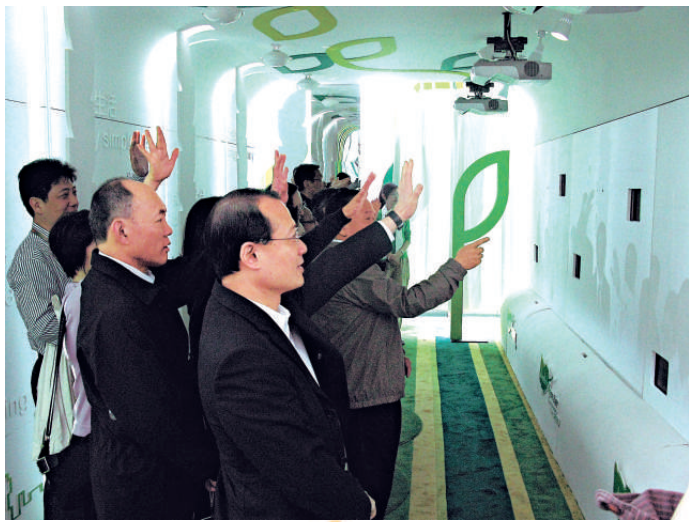
◀ VIP 參觀團在試玩互動遊戲