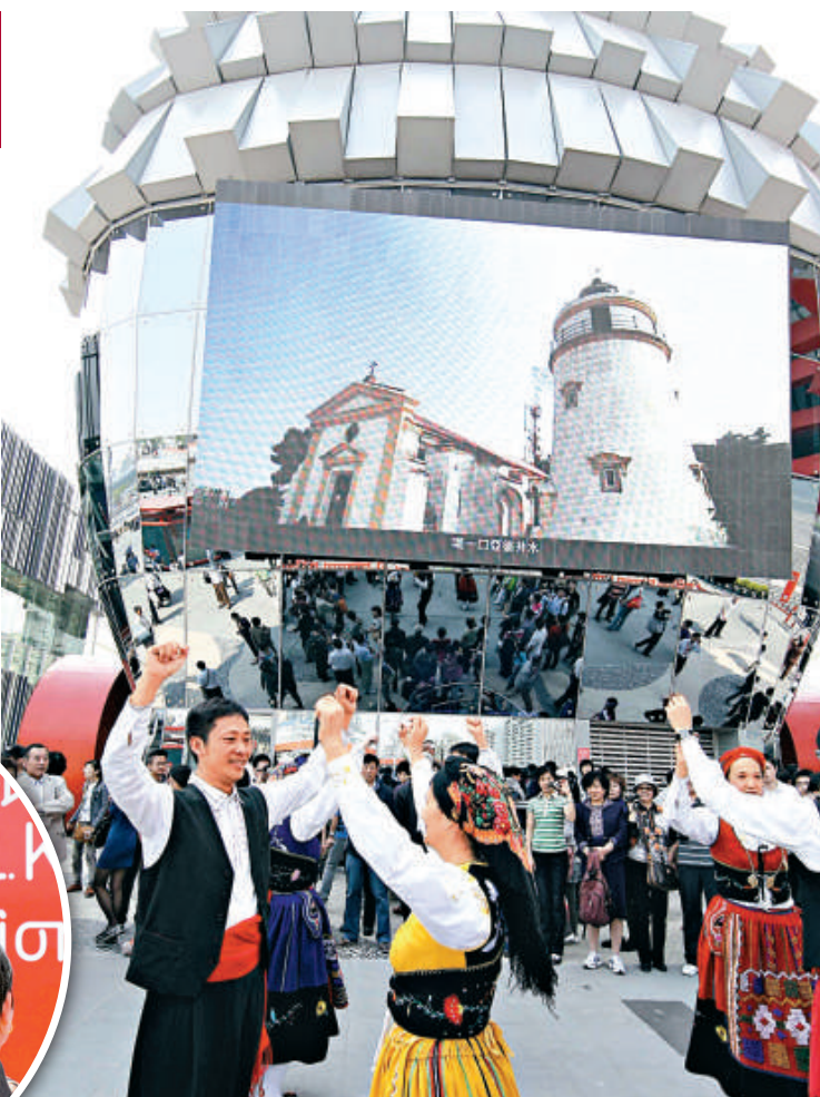
▲ 1日，來自澳門的演員在澳門館前載歌載舞表演助興