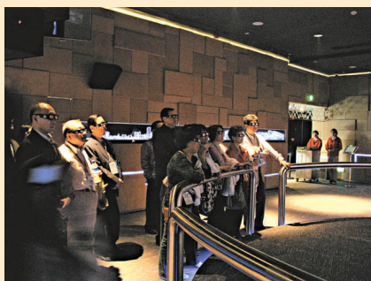
▲ VIP 參觀團觀看3D短片