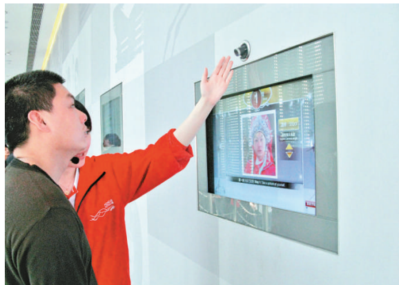
▲ 參觀者在香港館內試玩新科技

香港世博事務辦公室主任陳子敬表示，永久保留要遵守世博慣例，主辦方需考慮場館的受歡迎程度，他希望香港館能得到更多市民支持。