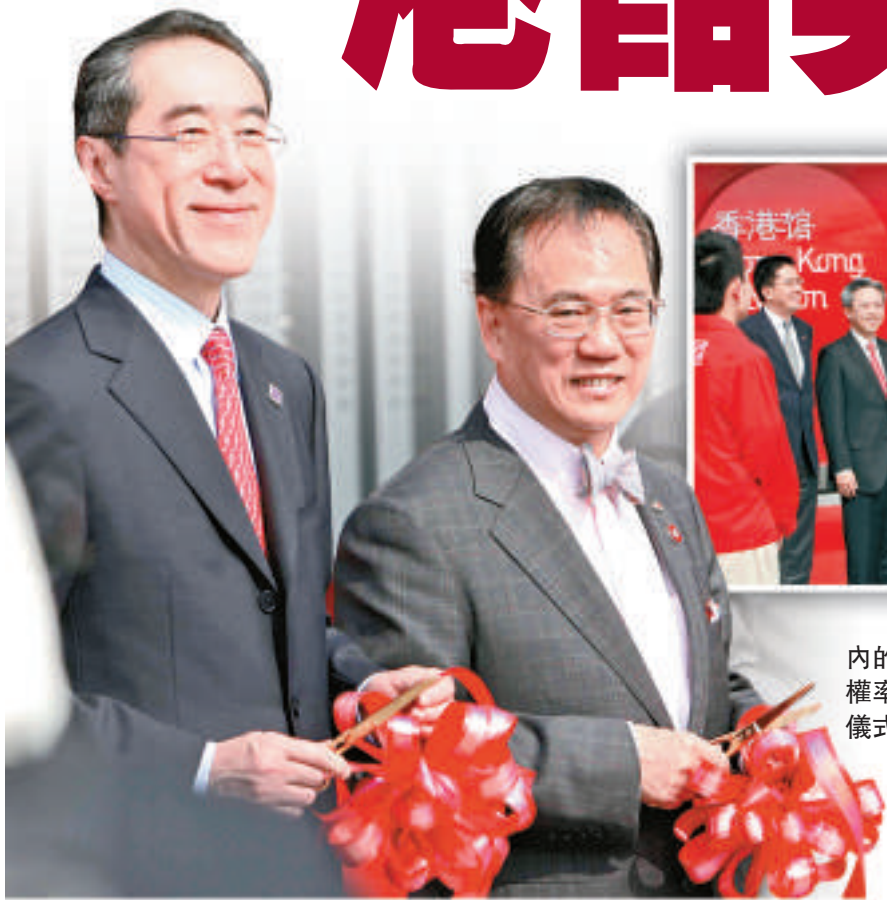
◀ 1日，上海世博園內的香港館開幕，特首曾蔭權率特區政府官員出席開幕儀式（中新社）