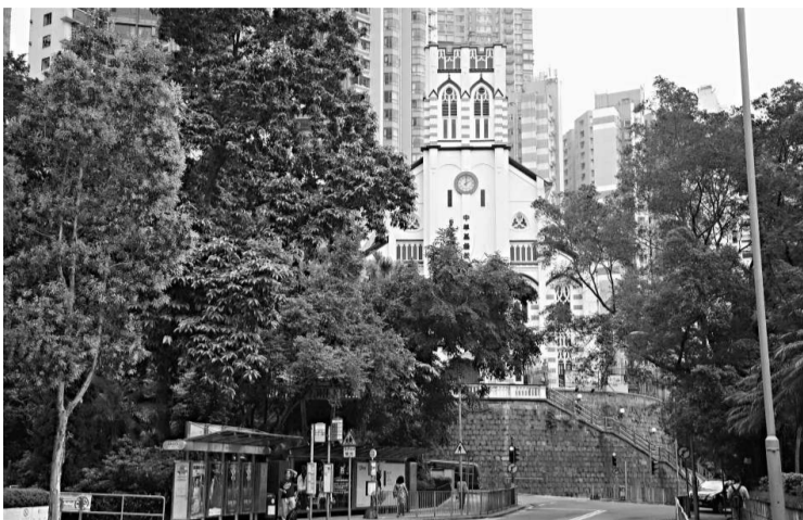
合一堂是「美景之地」少數仍保留的建築