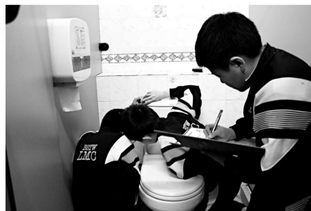
▲水務署推出「校園用水考察」先導計劃。圖為學生負責測量及記錄校園耗水量