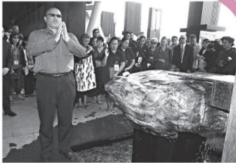
▲新西蘭館「鎮館之寶」Pounamu玉石重達1.8噸

與法國一樣，希臘通過瑰寶傳遞文化精神的參展國還有丹麥。為傳播童話文化，丹麥著名雕塑家艾里克森依據安徒生童話《人魚公主》鑄造的國寶「美人魚銅像」也在上海世博園與遊客見面。這是「美人魚」近百年來首次離開丹麥對外展出，丹麥官方相信