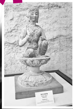
▲供養菩薩像

「金色女子像」於1923年創作，以紀念在第一次世界大戰中犧牲的盧森堡志願軍，這尊金像是盧森堡國家文化遺產的重要組成部分，由著名的盧森堡藝術家 Claus Cito 創作，象徵着自由和國家主權。