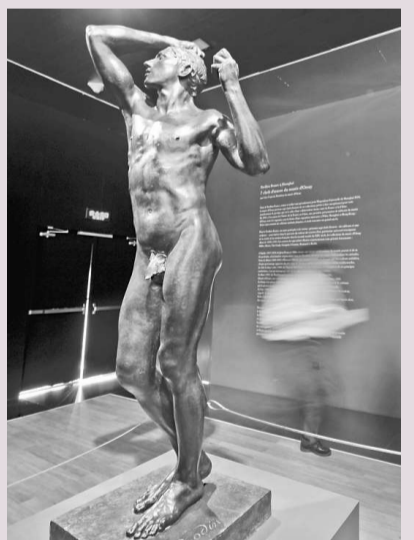
▲法國館內雕塑家羅丹的《青銅時代》（新華社）