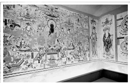
▲敦煌壁畫 ▼盧森堡館

「曾侯乙銅鑿缶」為戰國早期文物，1978年湖北隨州擂鼓墩1號墓出土，同時出土兩件，造型、紋飾、大小均同。現藏於湖北省博物館和中國國家博物館，此次展出的是國博館藏原件。銅鑿缶是古代用以冰（溫）酒的器具。它由內外兩件器物構成；外部為鑿，鑿內置一尊缶。鑿與尊缶之間有較大的空隙，夏天可以放入冰塊，冬天則貯存溫水，尊缶內盛酒，這樣就可以喝到「冬暖夏涼」的酒。