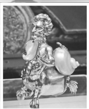
▲德國綠穹珍寶館的酒器