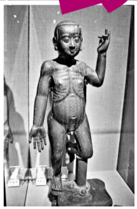
▲針灸穴位銅人（網上圖片）