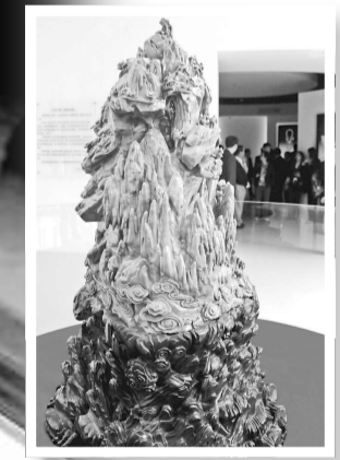
▲震旦館鎮館之寶「玉仙子」