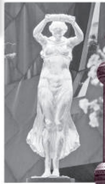
▲金色女子像矗立在盧森堡館前廣場