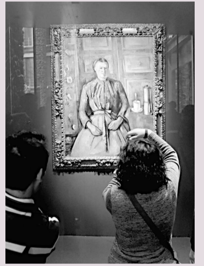
▲遊客在觀賞塞尚的作品《咖啡壺邊的婦女》

泊爾館的「佛祖真身舍利」和盧森堡大公國的「金色少女像」。尼泊爾此次參展世博會的「佛祖真身舍利」供奉於尼泊爾館佛塔塔心，這是舍利首次離開國土。尼泊爾計劃公開展出約30天，觀眾通過螺旋上升階梯瞻仰舍利的同時，也寓意佛祖的啟蒙之路。由盧森堡著名藝術家克勞斯西托於1923年創作的「金色少女像」，被盧森堡人賦予了「自由和抗爭」的意義。據介紹，金色少女是為紀念一次大戰中陣亡的3000名盧森堡士兵而建。