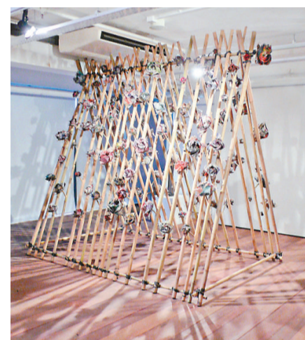
麥翠影作品《花花草草》