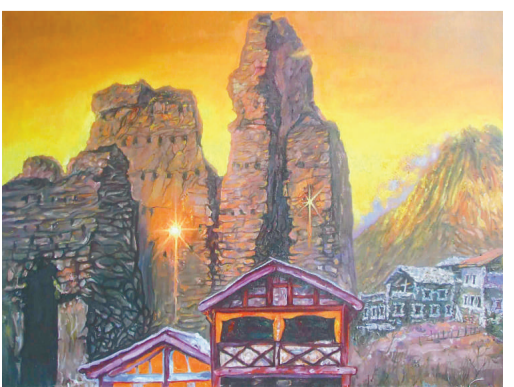
油畫作品《羌碉殘垣》

羌碉，是遠古戰爭時期羌族的標誌建築，用以防禦敵人，被譽為屹立千年不倒的「東方古堡」。它們經歷了上千年的風雨剝蝕而巍然屹立，