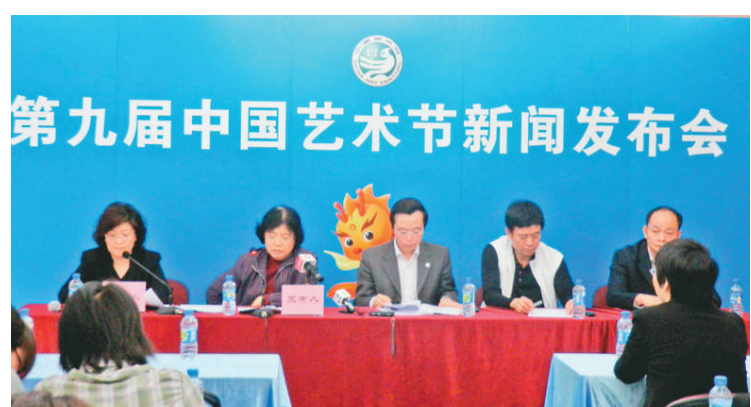
第九屆中國藝術節新聞發布會