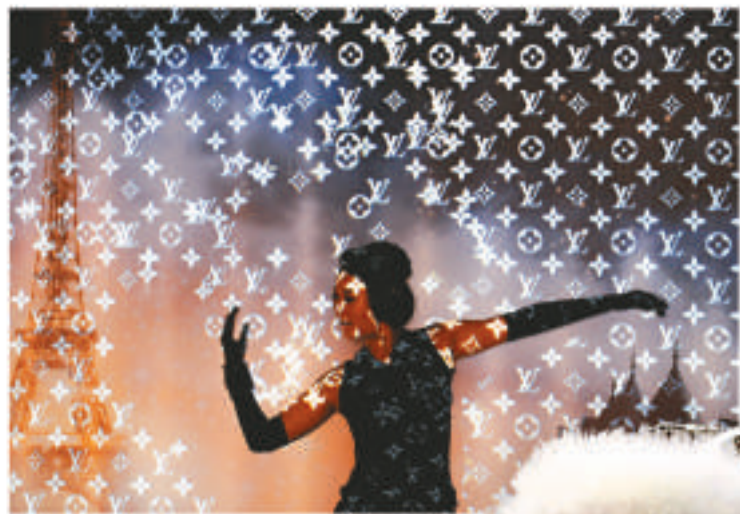
◀一位藝人在法國館進行表演，展示法國的品牌文化