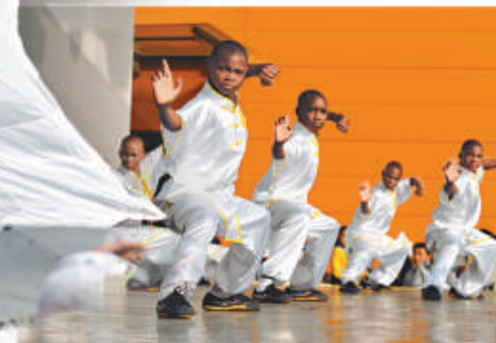
▲來自非洲馬拉維的青少年表演自己所學的武術和中文歌曲