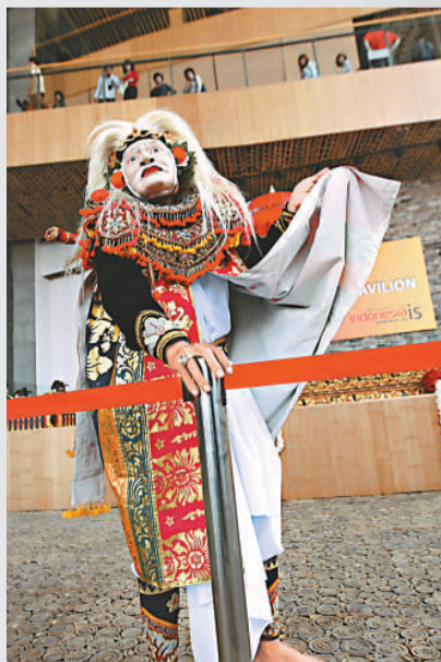
▲來自印尼的藝人正在表演其民族傳統舞蹈（美聯社）

最後，在郎朗的伴奏下，宋祖英、安德烈·波切利和周杰倫三人合唱了蘇格蘭民歌《友誼地久天長》，預示着2010上海世博會歡迎世界各國友人歡聚上海，為整場音樂會畫上了完美的句點。