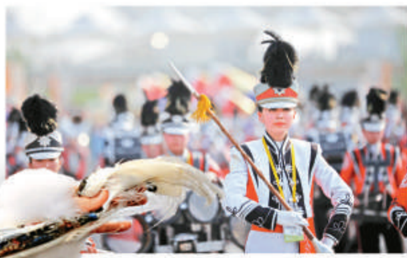
▶韓國樂團在世博園內巡演（中新社）