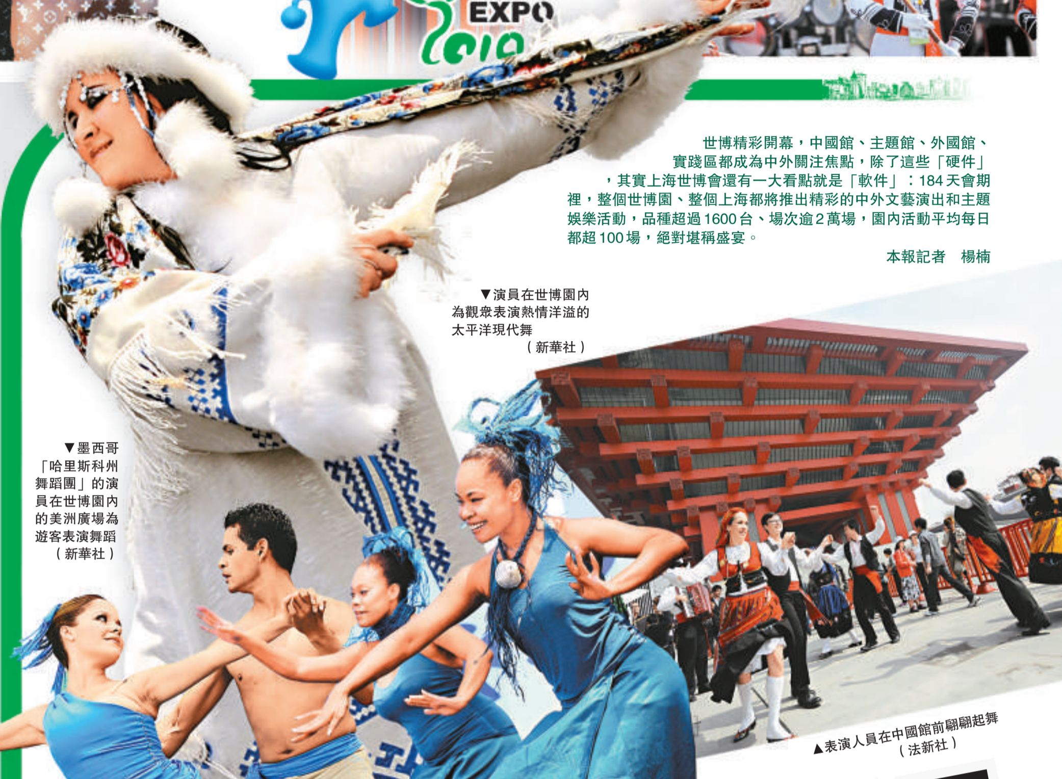
▼演員在世博園內為觀眾表演熱情洋溢的太平洋現代舞