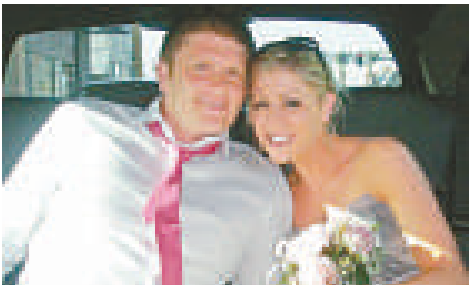
英漢邦德在美國拉斯維加斯一家酒吧遇到布里埃爾森，兩人在相識不到17小時內便結為夫婦