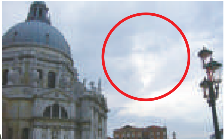
4月中旬，意大利一座教堂上空出現了「魔鬼的臉」

醫學上曾有不少其他研究顯示，避孕藥中的黃體素成分和孕婦分泌的泌乳素一樣，都會使女性產生幸福感，也會讓女生的感情比較豐富，因此醫生建議，女性在生理期前可以適度服用避孕藥搭配綜合他命和鈣片，都能有效幫助穩定情緒。 （綜合報道）