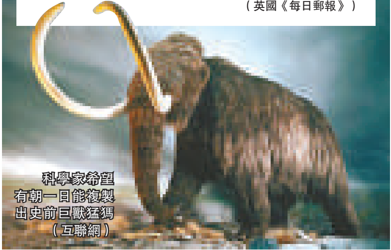
科學家希望有朝一日能複製出史前巨獸猛獁