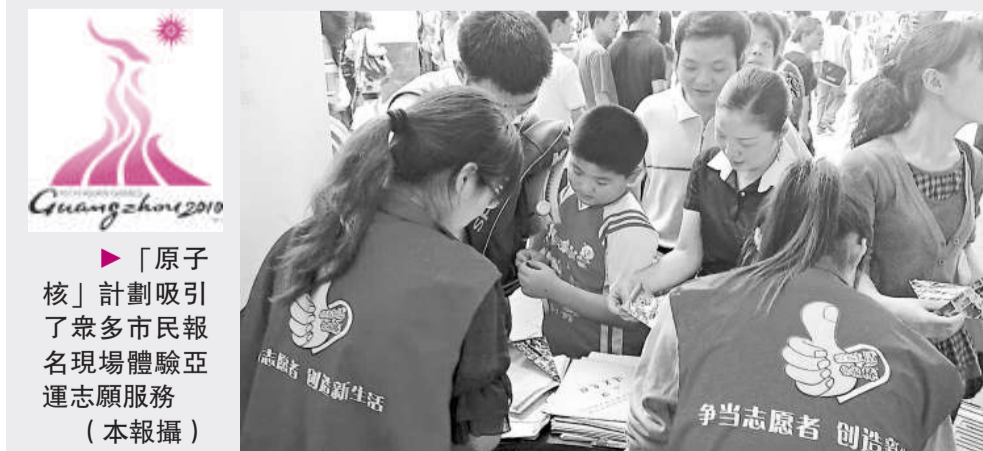
「原子核」計劃吸引了眾多市民報名現場體驗亞運志願服務

【本報記者袁秀賢廣州三日電】亞組委志願者部今天正式啟動「微笑東道主「原子核」計劃——亞運城市志願服務站(點)全民體驗活動。據悉，亞組委志願者部計劃在今年 11 月前完成建立並啟動 500 個城市志願服務站(點)。