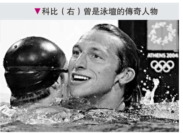
科比 (右) 曾是泳壇的傳奇人物

報道還引用科比朋友兼經理人弗拉斯克斯的話說：「沒有什麼事是不可能的，但據我所知，科比目前沒對眼前的事做什麼驚天動地的大計劃。科比的狀態很好，體重減了很多，仍在堅持訓練……(他復出)將是一段佳話，會是非常精彩的比賽。」