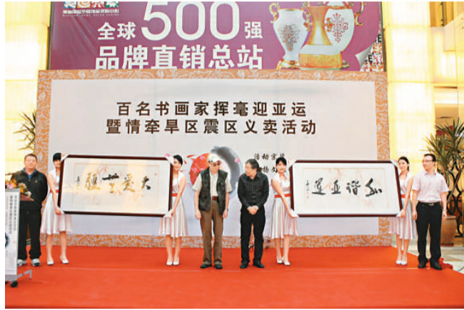
書畫家揮毫作品義賣，捐給災區，幫助災民渡過難關