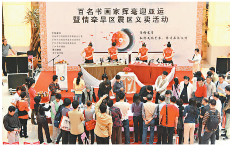
情牽災區，百名書畫家揮毫義賣現場