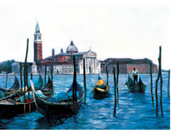
▲《威尼斯》(布面油畫) ▶《紅旗》(布面油畫)

今年恰逢陳逸飛逝世五周年，上海美術館、陳逸飛藝術基金會等機構攜手策劃，推出陳逸飛藝術展。在策展人、基金會和陳逸飛的親屬一起努力下，共徵集陳逸飛油畫作品真跡五十八件，素描速寫作品十五件，雕塑作品小樣兩件，以及陳逸飛與其逸飛集團出版發行的各種出版物若干，在上海美術館展出。這也是陳逸飛逝世後首次大規模回顧和展出其生前作品。