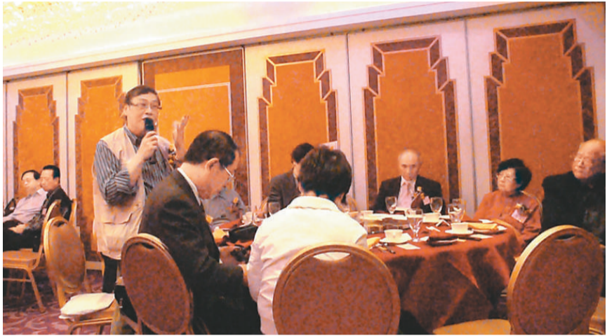
文學界人士熱烈提問