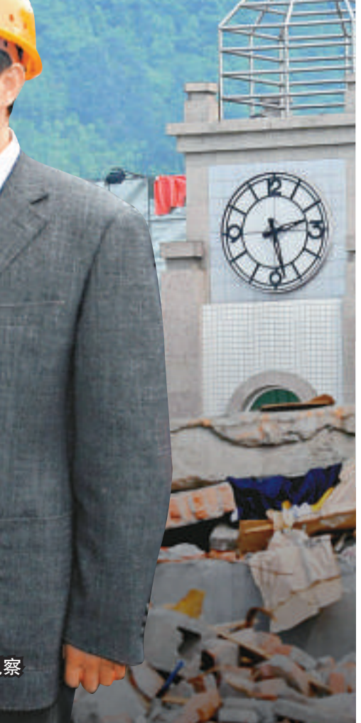
劉奇葆書記視察災區重建工地