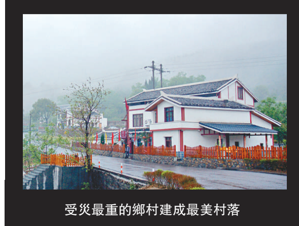
受災最重的鄉村建成最美村落