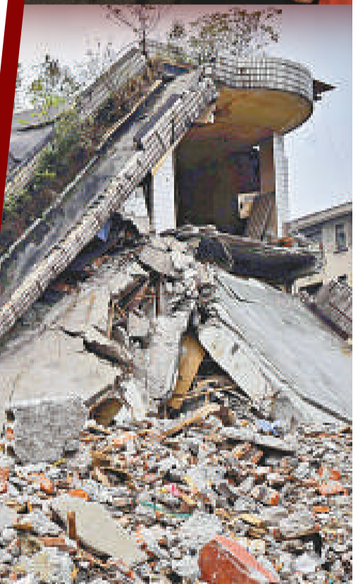
都江堰市騰達體育俱樂部的廢墟