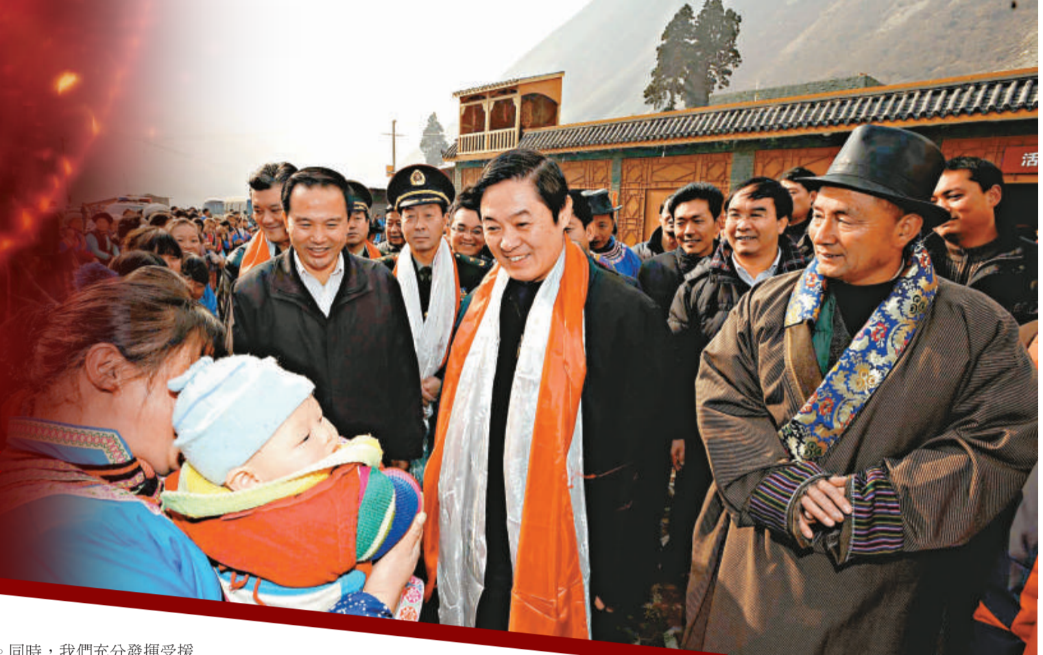
劉奇葆書記視察重災區汶川

我們熱忱歡迎廣大港澳及海外企業和客商繼續關注四川、支持四川、投資四川，實現互利雙贏，共創美好明天！