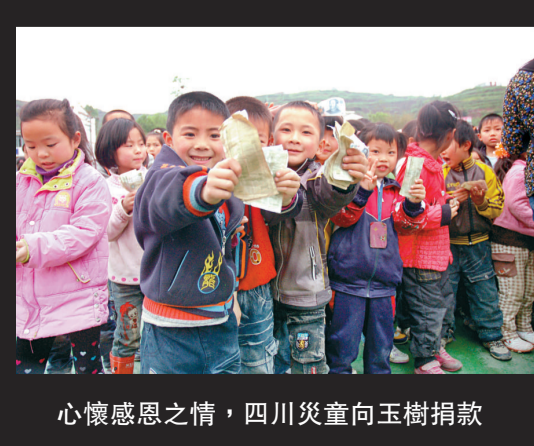
心懷感恩之情，四川災童向玉樹捐款