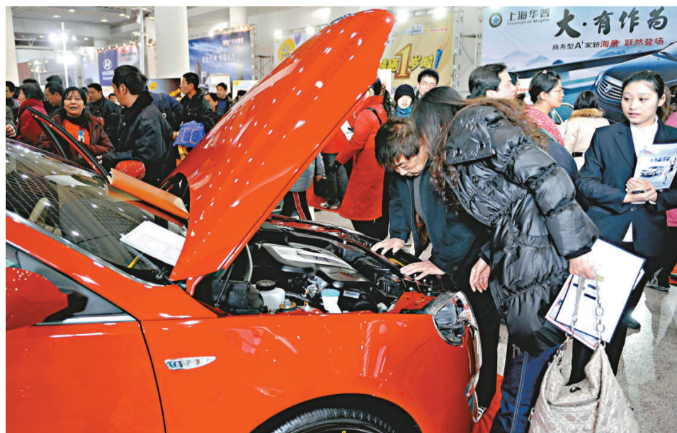
汽車協會料五月份車市繼續保持暢旺