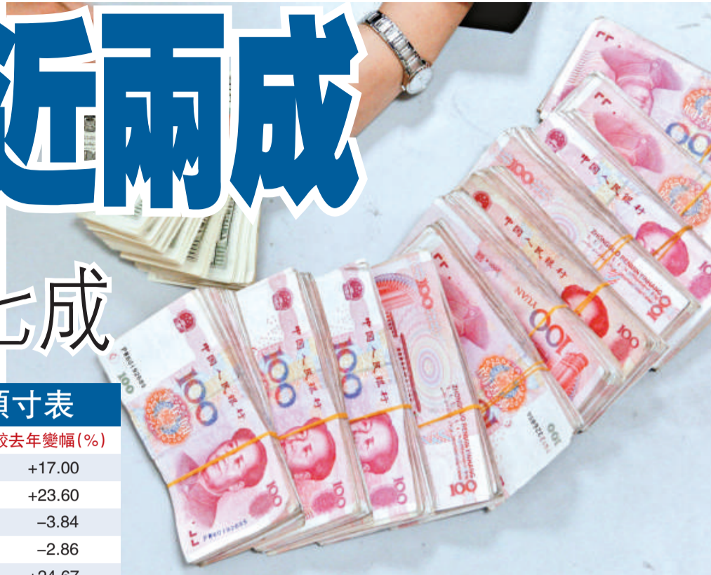
內地全社會外匯總資產繼續大幅增長

此外，在對外金融負債中，外國來華直接投資9974億美元，證券投資1900億美元，其他投資4508億美元，較〇八年末升8.9%、13.3%、18.8%，分別佔對外金融負債的61%、12%和28%。各分項中除包括債券、國庫券等的債務證券跌11.63%外，其他均取得不同程度升幅。