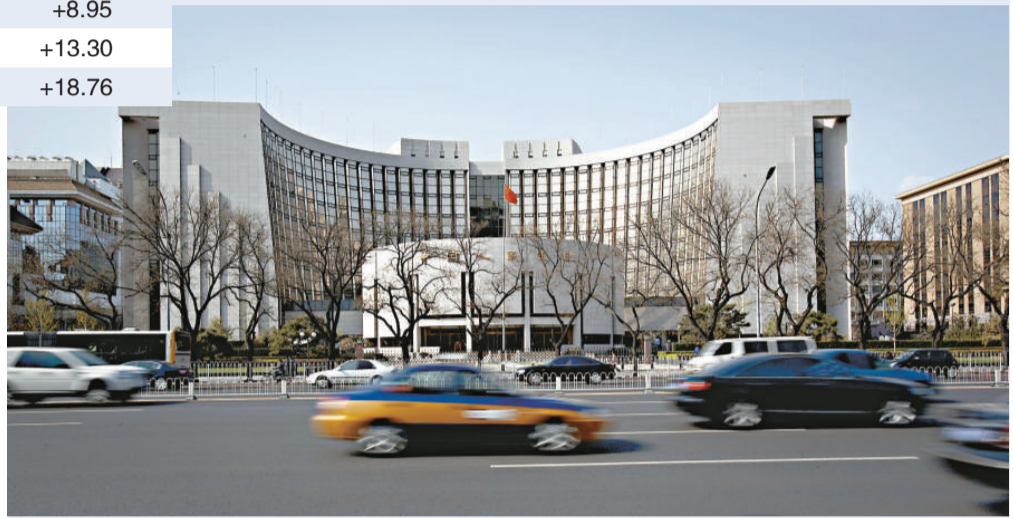
外匯儲備佔內地外匯總資產超過七成